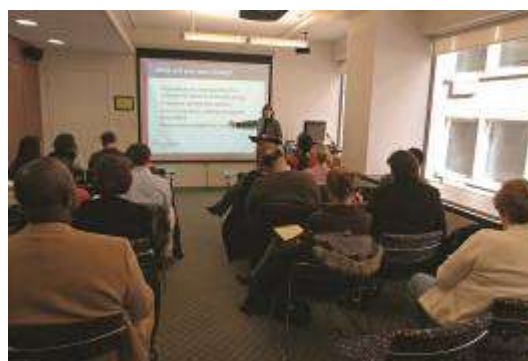
トレーニングクラス受講風景

FC では、NPO 職員を対象にして NPO 運営のための実践的知識を身につけさせるための教育プログラムを実施している。大きく分けると 60 分から 90 分程度で基礎を教えるトレーニングクラス（無料）と、丸 1 日以上（場合によっては 1 週間）の期間を設けてより専門的な研修を行うコースとがある（125 ドル以上）。内容は、NPO 運営に欠かせない資金調達の面を重点に置き、「助成金の情報をどう