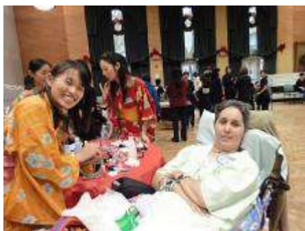
The Japanese Spa dayの様子

「The Japanese Spa Day」は、高齢者施設に入居している方にメイク、ネイルケアなどを施し、豊かで充実した時間を提供することで彼らの QOL (Quality of Life) を向上されることを目的としている。その他、初期から続けている環境美化活動「US-Japan Friendship Clean-Up」や、日本からのボランティアツアーの企画・運営などを実施している。