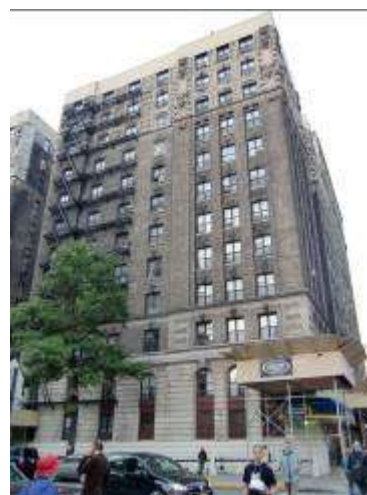
事務所はアパートの10階にある

NYdVが現在行っている事業のうち、最も規模の大きなものは「Explore Japanese Culture After School Program」である。この事業は、2007年からニューヨーク市政府から委託されている児童向けの放課後プログラムで、市内に約35箇所ある公共施設（レクリエーション・センター）において、子ども達に日本文化を紹介することを通じ