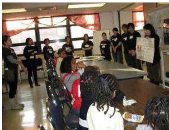
Japanese Explore Culture の授業風景

このプログラムは、他団体のものとは大きく異なる斬新なプログラムとして関係者から高い評価を獲得し、2011年には2年連続3回目となる「Volunteer of the year」を受賞した。