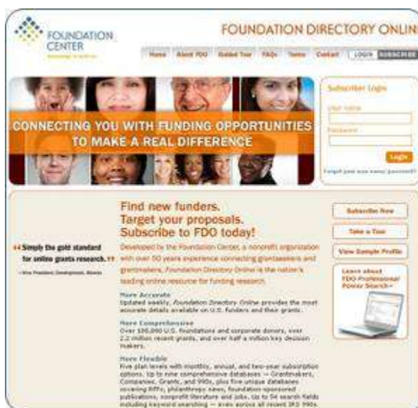
Foundation Directory Onlineのトップページ

データベースには、財団や寄付者の基本的な情報から、資金提供者が過去にどのような分野や地域に助成実績があり関心が高いかといった分析用の情報、コンタクトを取るべき担当者名などの具