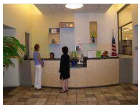
受付デスク。FC はビルの 2 階を占有する

では、FC にはどのような職員が働いているのだろうか。職員のほとんどは、大学の博士課程や修士課程を卒業した、高い教育を受けた人間で占められているとのことであった。例えば私が直接話を伺った Suzan Shiroma 氏は、図書館司書の資格を持ち、その専門性を生かして NPO