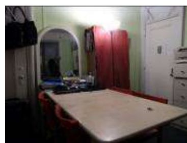
自宅隣室に賃借した打合せ部屋