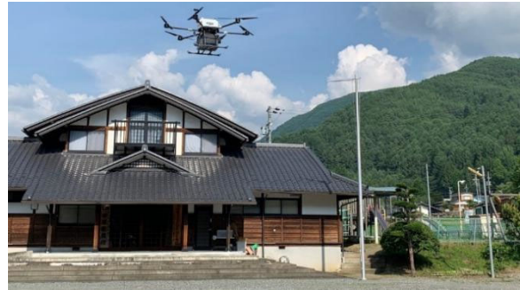
物流无人机在每个工作日下午航行

伊那市互助购物服务“友爱超市”从 2020 年 8 月起运营，旨在使用物流用无人机为购物不便的人们提供帮助。