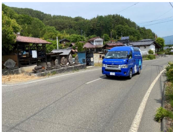
照片 5 行驶在当地的车上无坐诊医生的移动诊疗车

使用绕圈圈出租车最多的目的是“去医院和诊疗所”。但是在地方上存在着医疗机构少、用户去医院路程远和在医院候诊时间长的问题。另外随着老龄化的加剧，对医生来说也有诊疗时间长和长途出诊等负担。