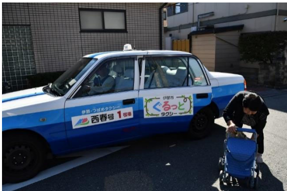
使用绕圈圈出租车的老年人

由于公交车使用率低、利润得不到保障，加剧了地方民间运营商的流失。再加之新冠疫情的蔓延，进一步给交通运营商的经营带来了压力。伊那市开始使用 AI 技术运营新的公共交通，这就是“绕圈圈出租车”亲民交通服务。