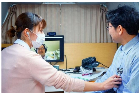
在车内由护士一边提供服务，一边实施在线诊疗

使用绕圈圈出租车最多的目的是“去医院和诊疗所”。但是在地方上存在着医疗机构少、用户去医院路程远和在医院候诊时间长的问题。另外随着老龄化的加剧，对医生来说也有诊疗时间长和长途出诊等负担。