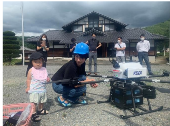
当地志愿者帮忙领取送到公民馆的包裹