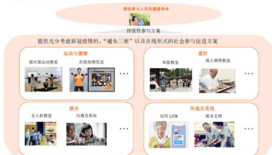
事业方面所提供的方案

由二十多家民间企业、NPO 等进行合作，在做好新冠防疫措施的前提下，以涉猎广泛的课题形式提供“避免三密”、在线形式的社会参与方案。