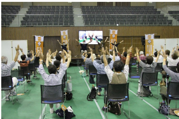
项目体验会的情景

此项事业内容已得到了某企业的好评，并向丰田市捐赠了事业资金。这也是堪称创新的原因所在。