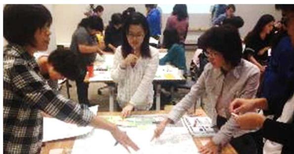
災害時外国人支援サポーター養成講座：避難所運営ゲーム