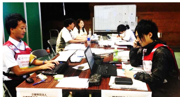
「美ら島レスキュー」での多言語支援センター開設訓練