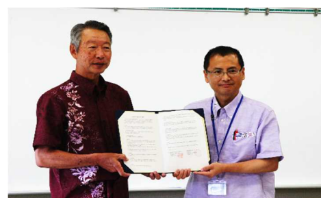
JICA 沖縄国際センターとの協定締結 (右: JICA 沖縄国際センター河崎所長)