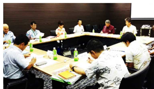
災害時外国人支援運営検討委員会