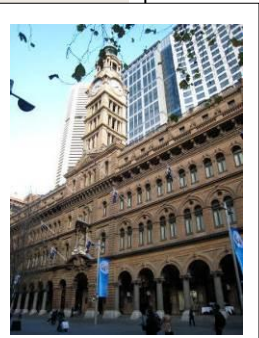
クレアのビルは GPO (中央郵便局) ↑ の正面にあります。

住所 : Level 12, Challis House, 4 Martin Place, Sydney NSW 2000 Australia