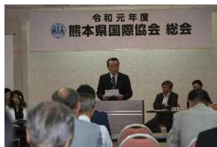
令和元年度熊本県国際協会総会