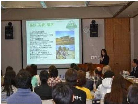
海外留学セミナー