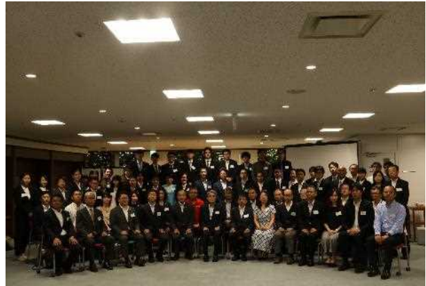
福岡アジア留学生里親奨学金交付式