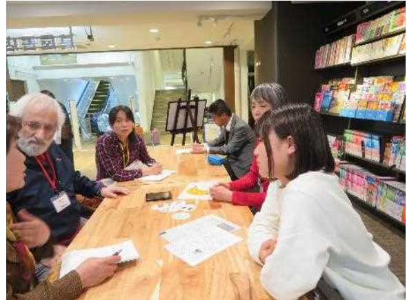
【国際ふれあいチャット（英語）】