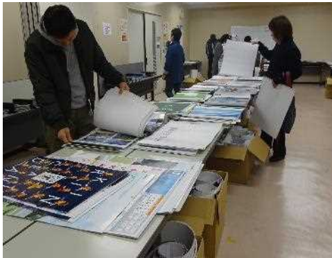
カレンダー市2019～あなたもできる国際協力～