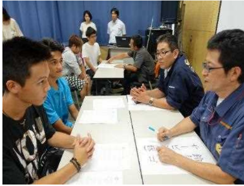
若者の就職支援セミナー