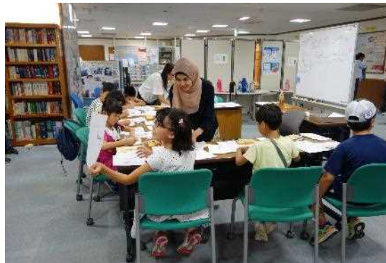
世界へGO！～子どもの多文化体験～