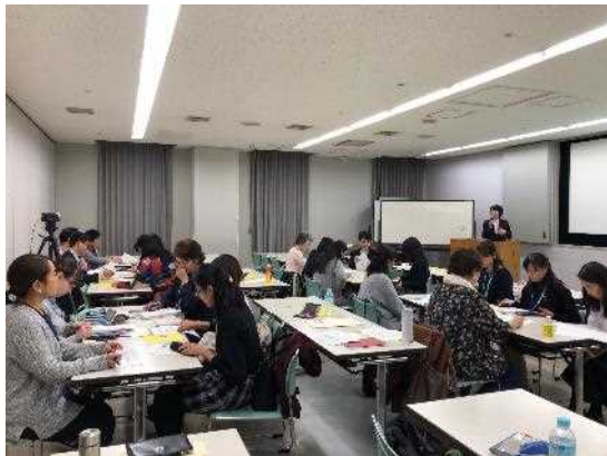
コミュニティ通訳育成講座