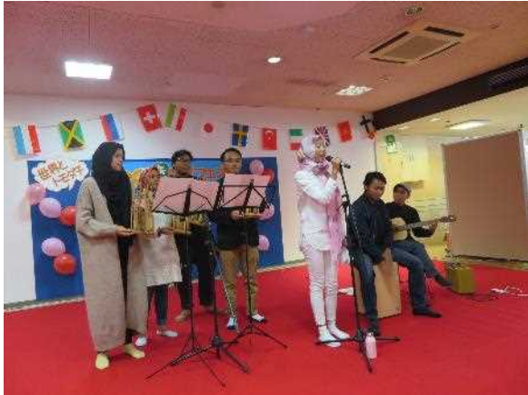
【みやざき国際フェス

団体等が行う県民の国際交流の推進に寄与する先駆的、効果的事業で原則的として一般県民が参加できる事業または一般県民への波及効果のあるものについて助成を行う。予算額（101千円）