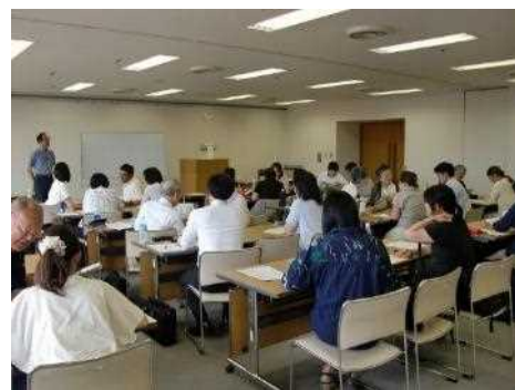
外国籍児童支援研修会