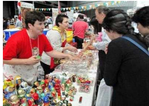
国際フェア (国際交流)