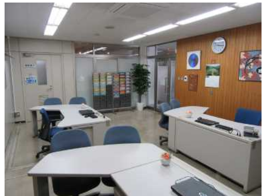
とちぎ外国人相談サポートセンター