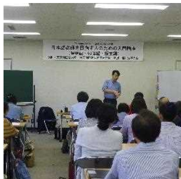
日本語指導者研修会