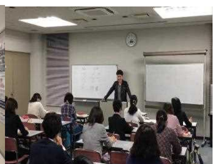
留学生から学ぶ外国語教室