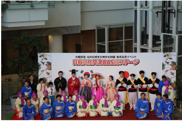
韓国光州市文化財団来県記念イベント