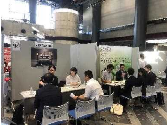
国際人材ラウンドテーブル：留学生と企業の交流会（場所 京都市）