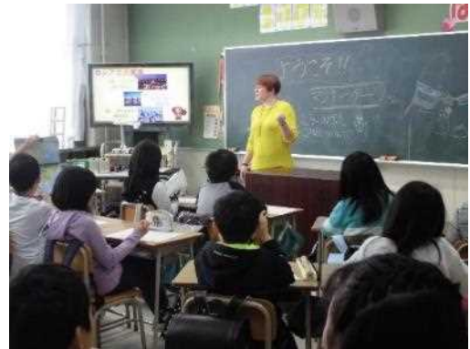
総合学習受入・派遣、出前講座支援事業 (国際交流員の派遣)