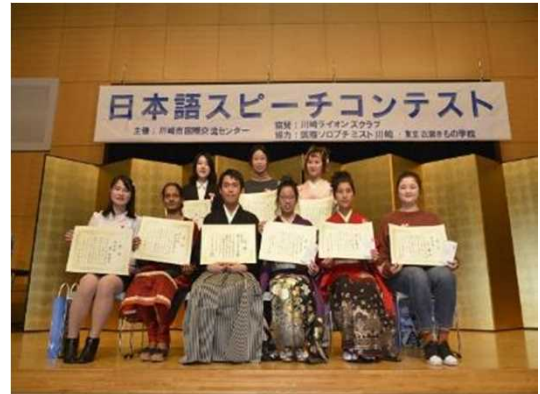
外国人市民によるスピーチコンテスト