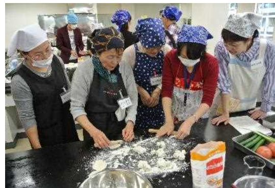
水餃子づくり交流会