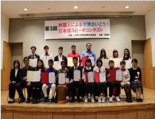
日本語スピーチコンテスト