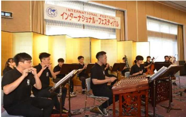
インターナショナルフェスティバルinカワサキ