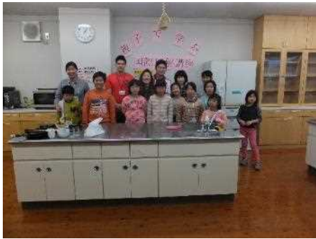
親子で学ぶ国際理解講座