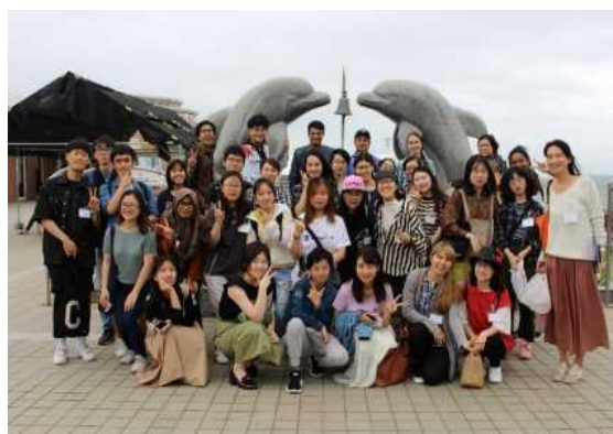
クエスト茨城留学生研修