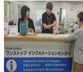
ワンストップ インフォメーションセンター