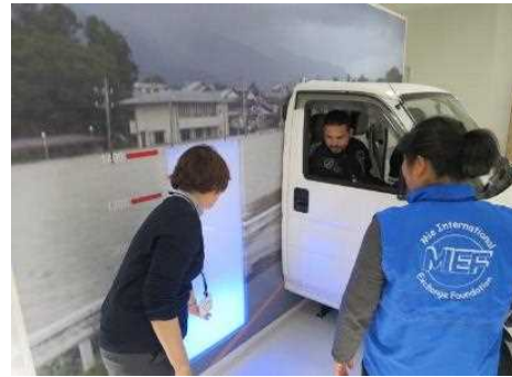
水に浸かった車からの救出体験