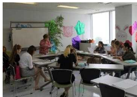
日本語クラスの様子