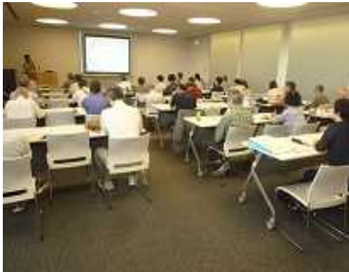
アジアを知る事業