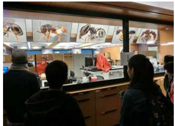
English and Cross-culture Seminar