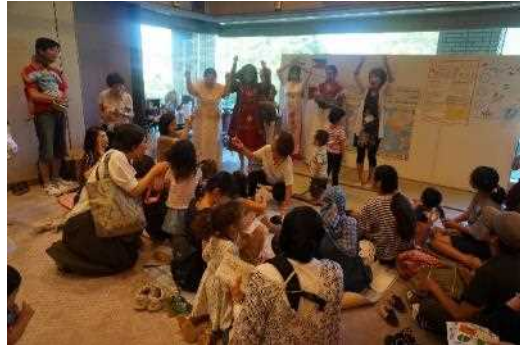
多文化子育てフェスタ