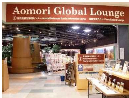
国際交流ラウンジ