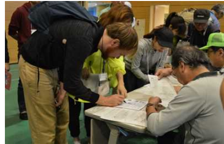
福島県総合防災訓練への参加