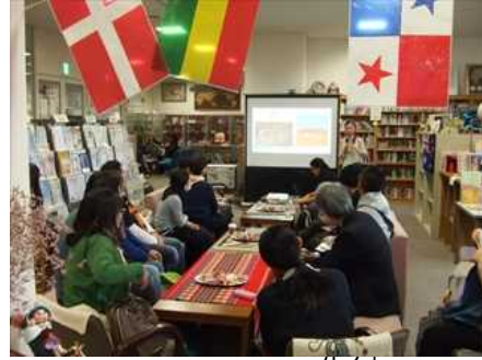
とびいりワールド茶館