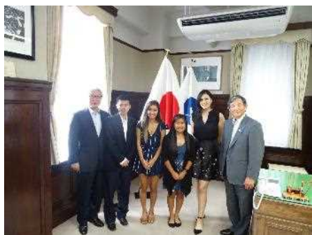
海外移住者子弟受入事業 で来日した学生が和歌山県庁を表敬訪問