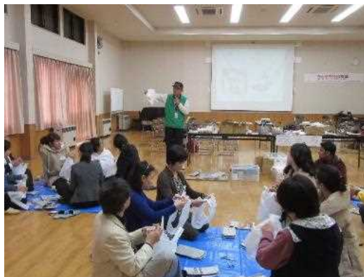
みんなの防災教室