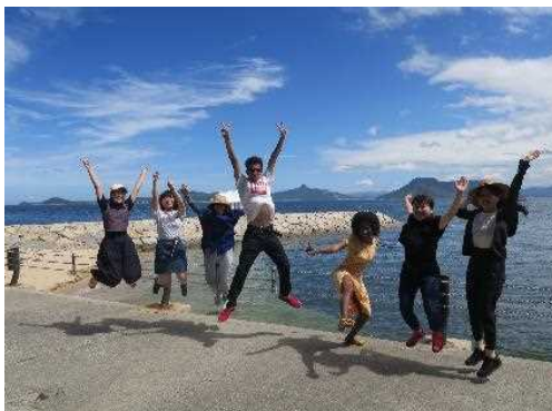
アイパル・JICA高校生カレッジ