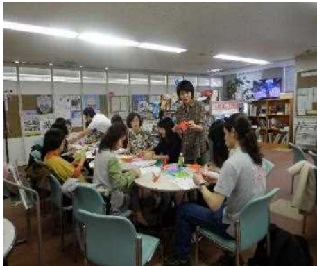
サロンカウンターの運営 (折紙ワークショップ)