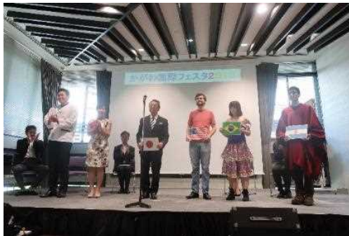
かがわ国際フェスタ