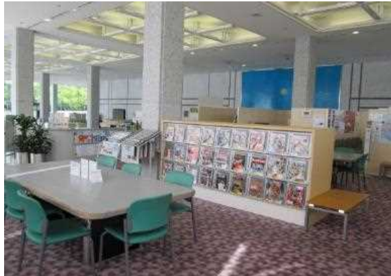
国際交流ラウンジ