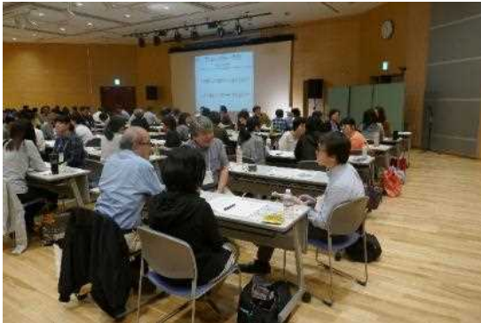
外国人案内ボランティア育成講座 (多文化共生)