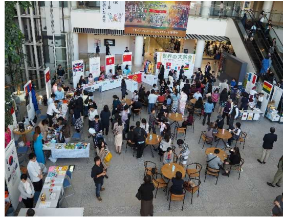
国民文化祭の協賛事業「世界の大茶会」