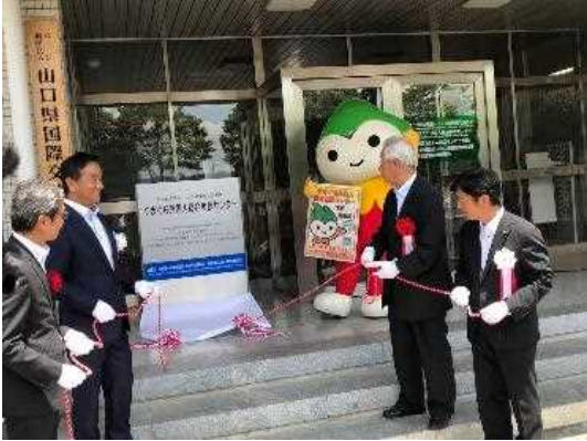
やまぐち外国人総合相談センターの開設

県は、外国人住民の増加に伴う相談件数の大幅な増加に対応するため、協会内に「やまぐち外国人総合相談センター」の設置し、運営を委託する。コーディネーター2名、タガログ語、中国語、ベトナム語、英語の相談員4名を配置し、相談体制を構築する。予算額：20,000千円