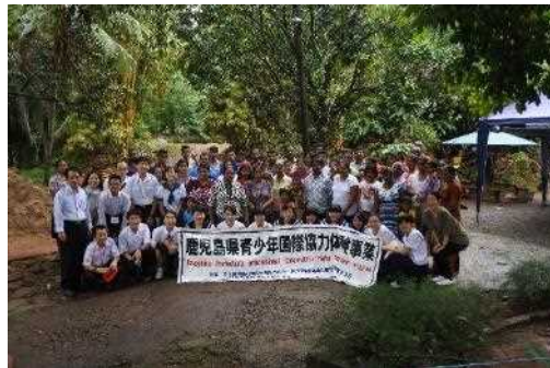
鹿児島県青少年国際協力体験事業 (スリランカ)