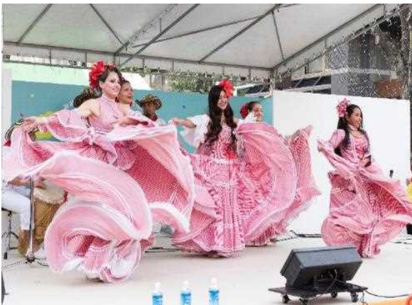
異文化コミュニケーション体験フェア