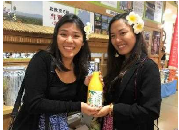
愛媛・ハワイ交流事業 (ハワイ・サマー・インターン)