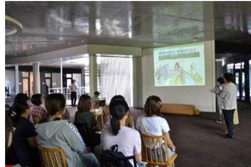
外国人住民防災力向上事業「防災教室」