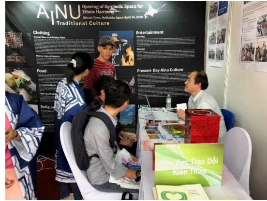
留学生受入促進事業 (ベトナムホーチミン市での留学プロモーション)