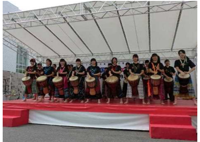
さが国際フェスタ