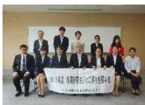
びわこ奨学金授与式