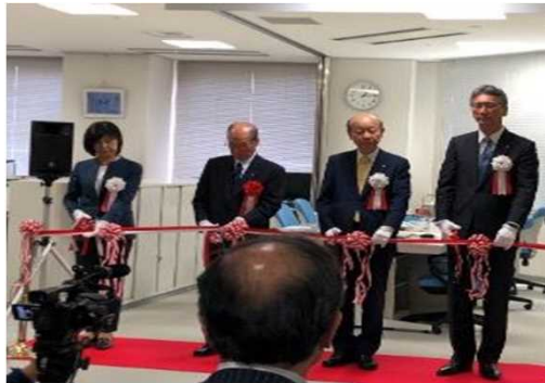
外国人ワンストップ相談センター運営事業