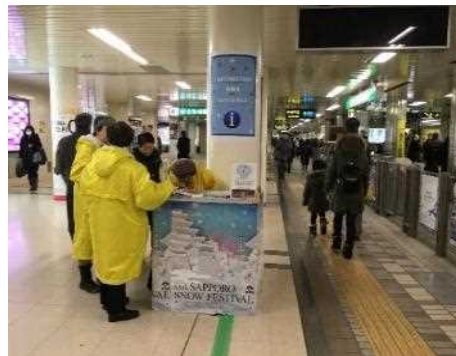
外国語ボランティア派遣と制度運営 (さっぽろ雪まつりでの活動)