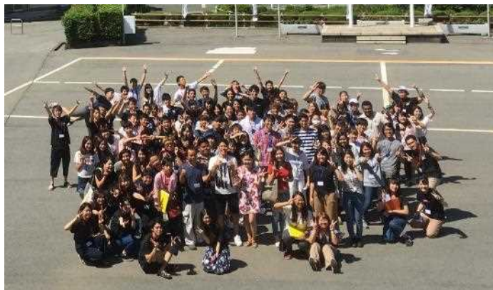
グローバルワークキャンプ