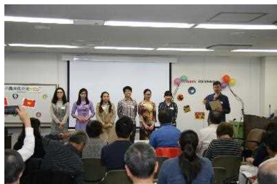
留学生との異文化交流サロン