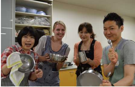
グローバルコミュニケーションカフェ