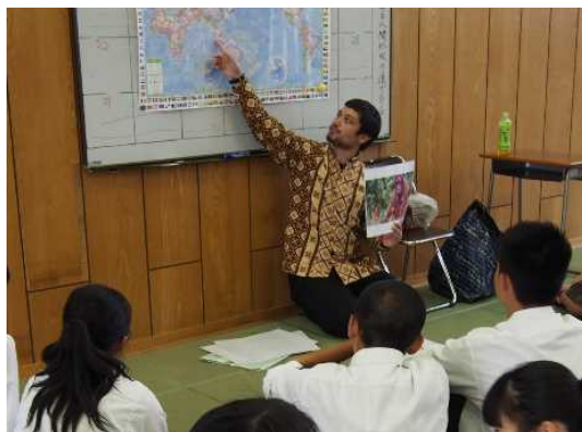
国際理解教育支援事業