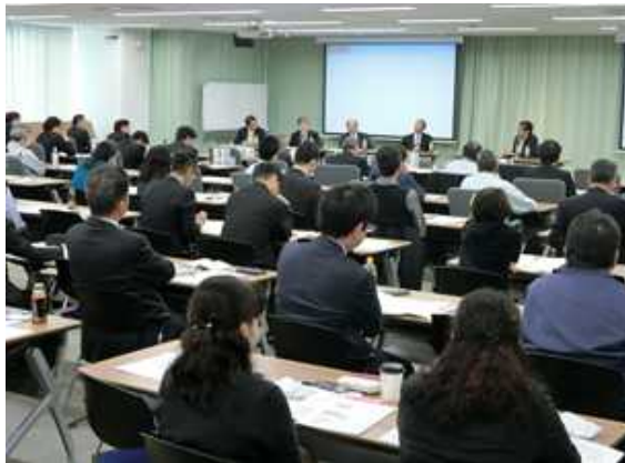
災害危機管理シンポジウム