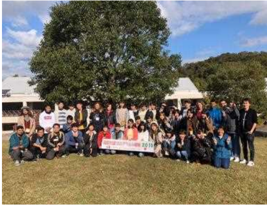
国際交流プログラムin徳地