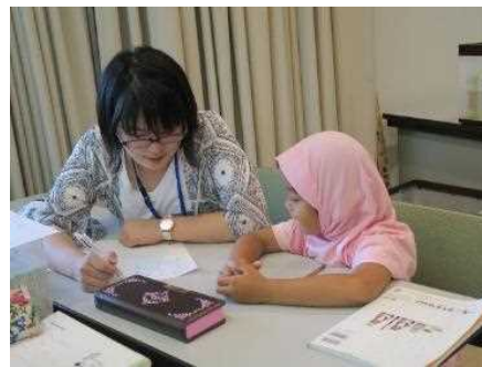
アイパルこどもにほんご教室