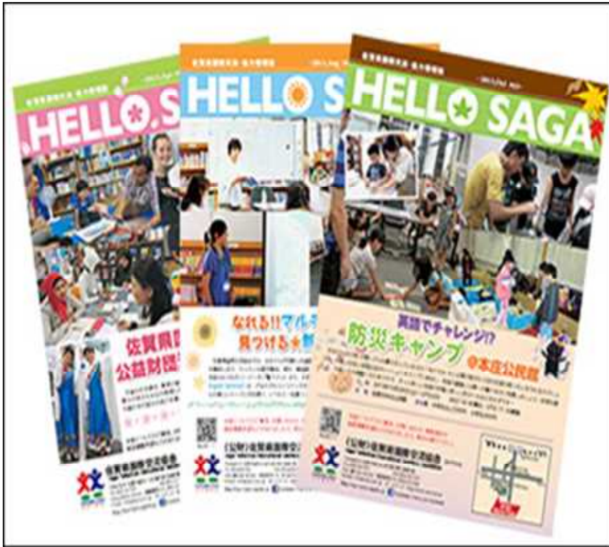
情報誌（ハローサガ）