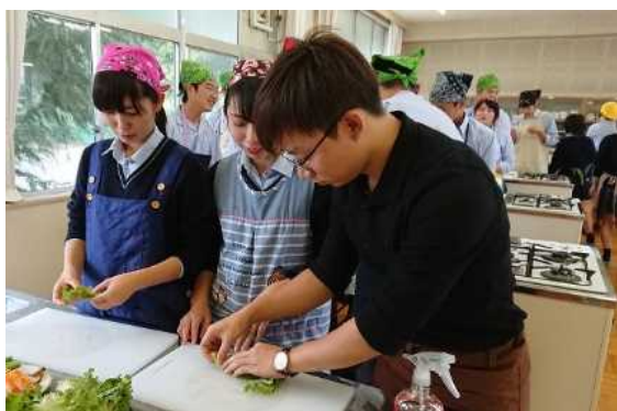
ワールドキャラバン事業