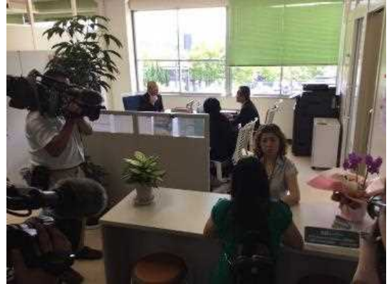
相談センター内風景