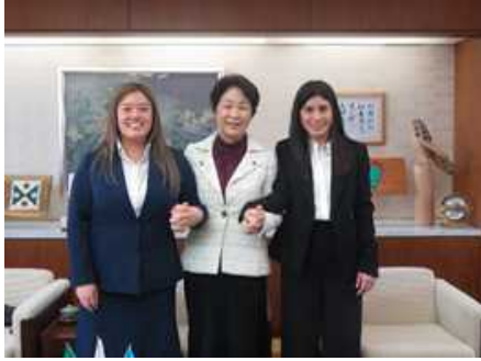
海外技術研修員受入事業