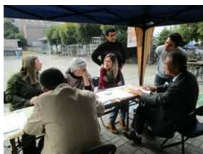
外国人のための就労支援事業