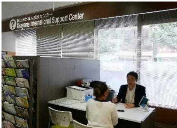
多文化共生総合相談センターの運営 (岡山県外国人相談センター)