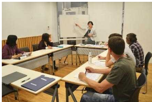
資格取得日本語講座「N3に合格しよう！」