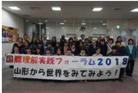
国際理解実践フォーラム2018