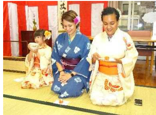
第20回ながさき国際協力・交流 フェスティバル