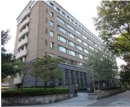
あいち国際プラザ