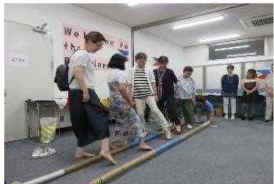
「おちゃっとサロン (フィリピン)」