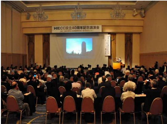
センター設立40周年記念講演会