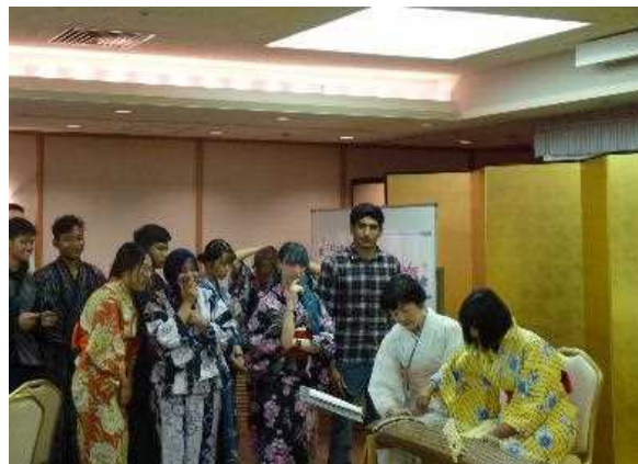
日本文化紹介事業 (お琴の演奏会)