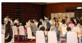
進路フェア（進路ガイダンス）