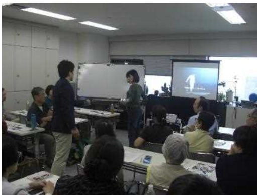
通訳ボランティア養成講座