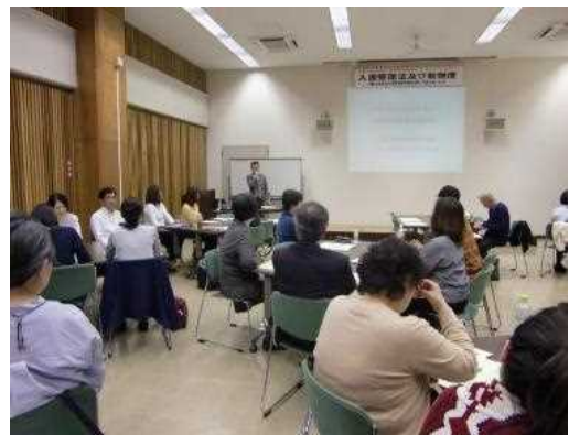
相談員・通訳協力者実務研修会