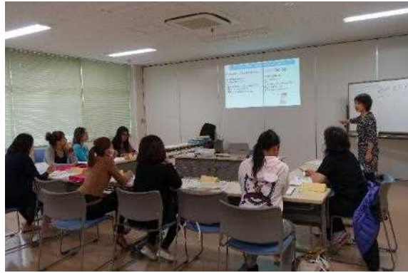
日本語学習支援講座