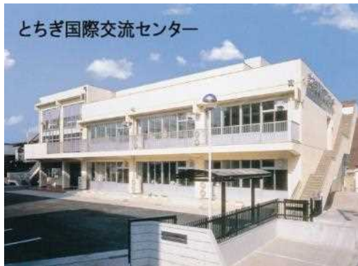
とちぎ国際交流センター センター外観