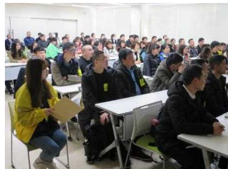
外国住民を対象とした防災説明会