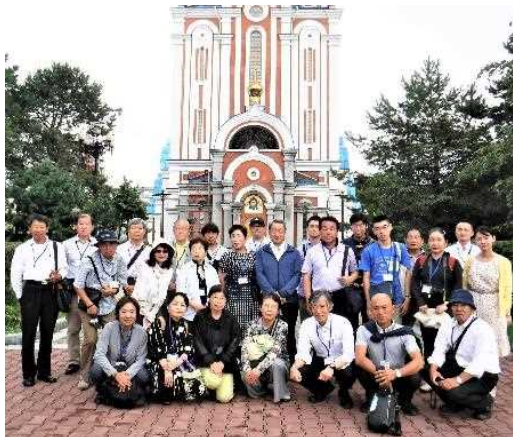
ハバロフスク地方友好提携50周年記念兵庫県民交流団