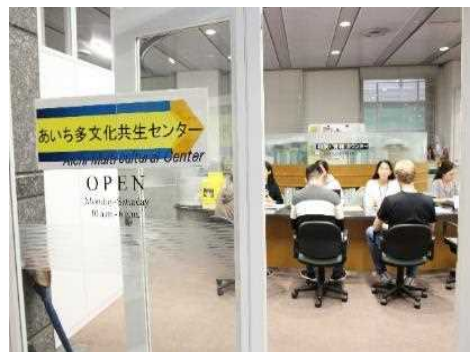
あいち多文化共生センター