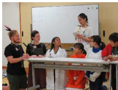
中高校生夏期英語セミナー