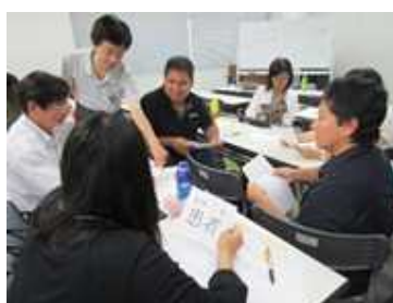
医療通訳者養成のための研修会