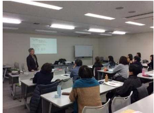
日本語ボランティアスキルアップ講座