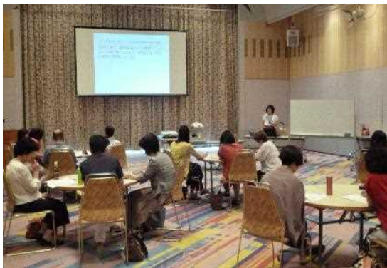
外国につながりをもつ子どもの学び を支える研修会 （場所 亀岡市）