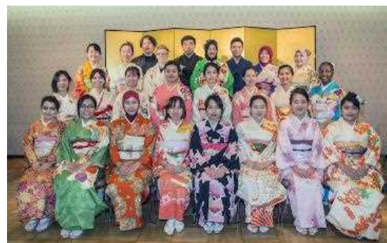
着物着付け体験会