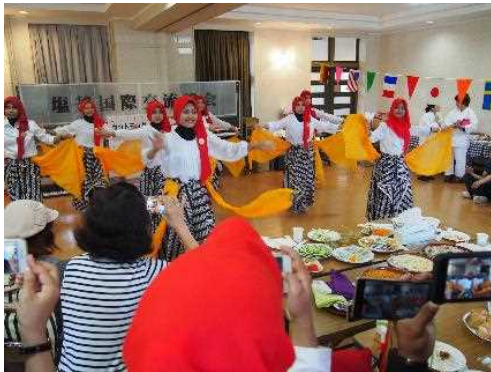
技能実習生地域共生支援事業