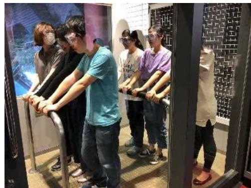
外国人防災研修 （場所 京都市）