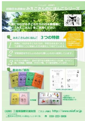
「みえこさんのほんご」シリーズ