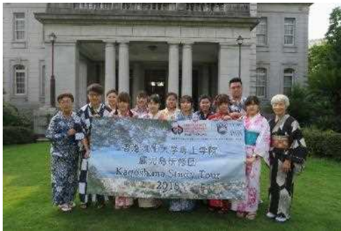
香港城市大学日本語研修事業