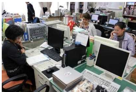
外国人相談センター