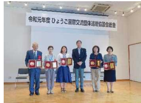
ひょうご国際交流団体連絡協議会総会を開催