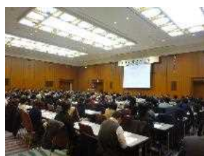
改正入管法セミナー