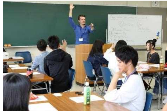
いわて青年国際塾