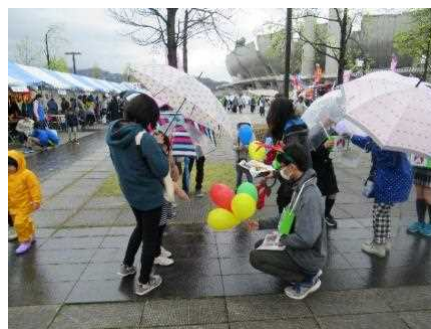
サンタプロジェクト募金