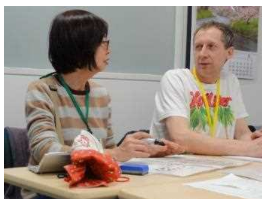
日本語支援事業にほんごのへや