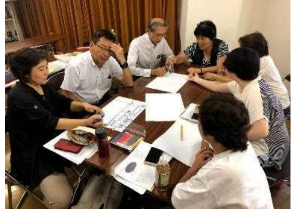
外国にルーツを持つ子どもの支援講座