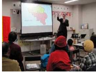
英語で語る自分の国