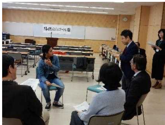
外国人住民とのコミュニケーション講座