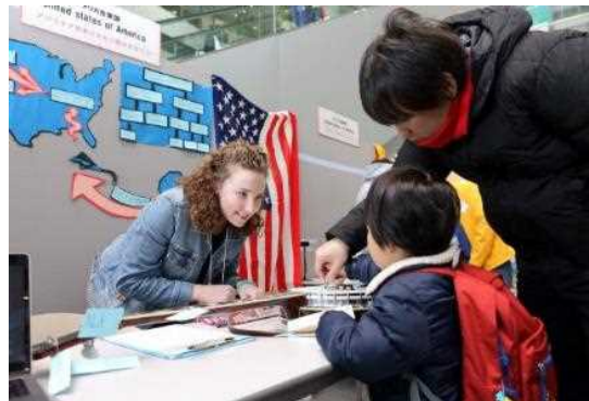
ワン・ワールド・フェスタ