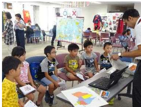
青少年国際理解講座 「学ぼう！遊ぼう！世界体験旅行！」