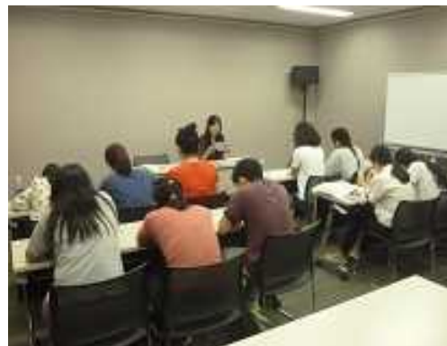
ホストファミリー整備事業