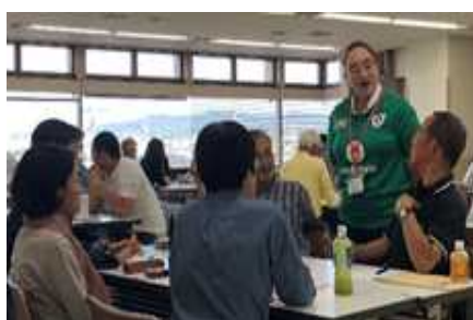
外国語ボランティアバンク研修会