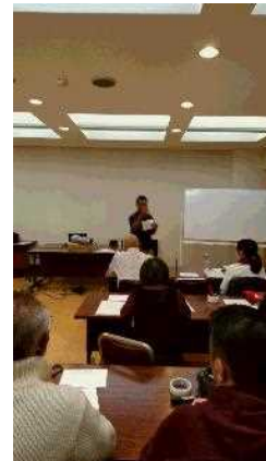
日本語ボランティア養成講座