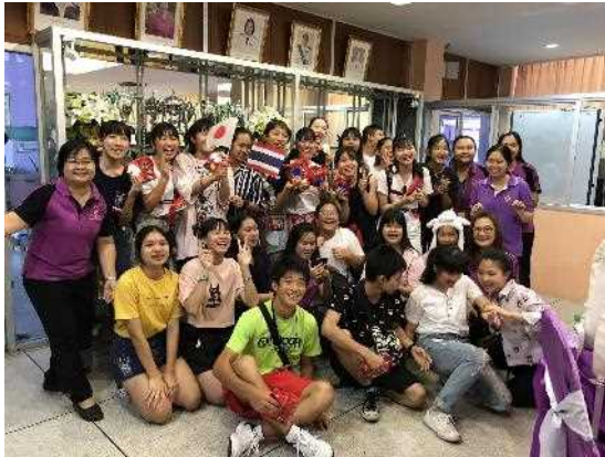
バンコク都立プラチャニヴェット高校との交流