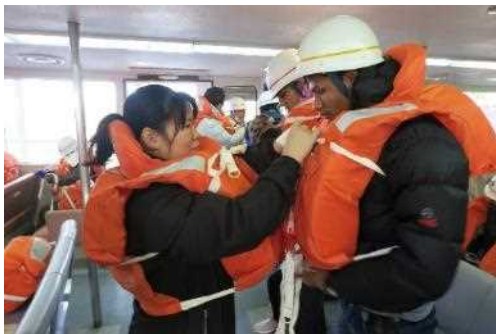
多文化共生地域づくり事業 (桜島火山爆発総合防災訓練)

在外県人会に情報誌等を定期的を送付し、郷土情報の提供を行う。また、ブラジル・ペルー・パラグアイ・アルゼンチンの県人会活動を支援するため、業務を県人会に委託する。 予算額：1,139千円