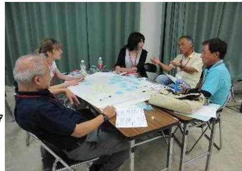
地域で活躍する日本語支援ボランティアが集まる研修会