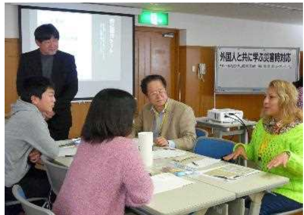
災害救援専門ボランティア (通訳・翻訳) 研修事業