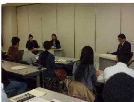
三沢基地内大学就学説明会