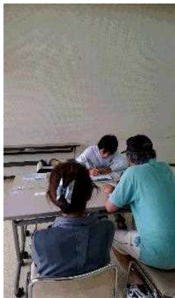
外国人のための法律相談