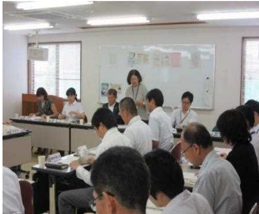
在県外国人相談・支援事業 (外国人生活支援ネットワーク会議)