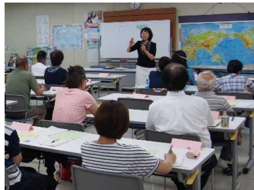
日本語サポータービギナー研修会