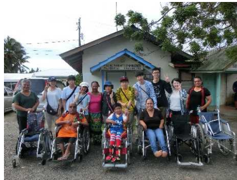
アジアの架け橋養成事業 (パラオ共和国にて車いすをお届けした障がい者支援団体の方々と)