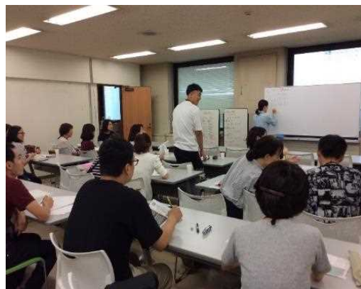
生活者としての外国人のための日本語講座