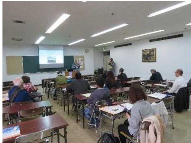
【外国人支援のための防災セミナー（外国人向け）】