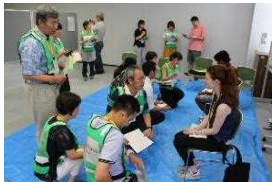
「外国人支援事業 (医療・災害)」