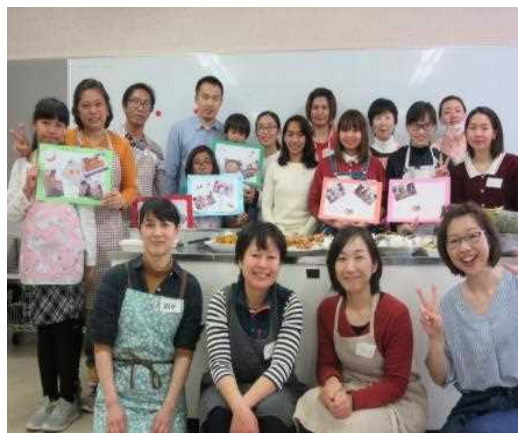
外国人日本語学習支援事業 (にほんごフィールドワーク)