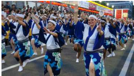
阿波おどり交流事業