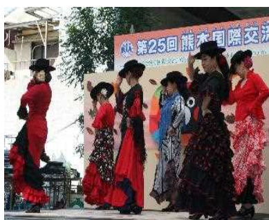
第25回熊本国際交流祭典