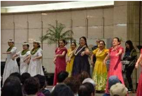
姉妹・友好都市の日記念イベント ホノルルの日