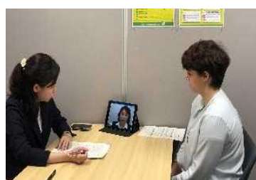
熊本県外国人サポートセンター