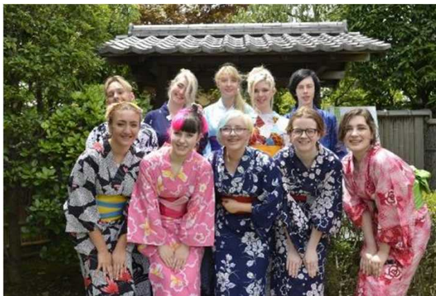
イギリス・アクワイナス高校生の抹茶・浴衣体験