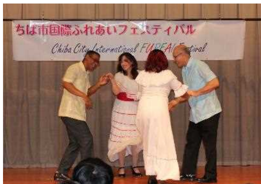
ちば市国際ふれあいフェスティバル