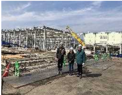
「海外技術研修員受入事業」