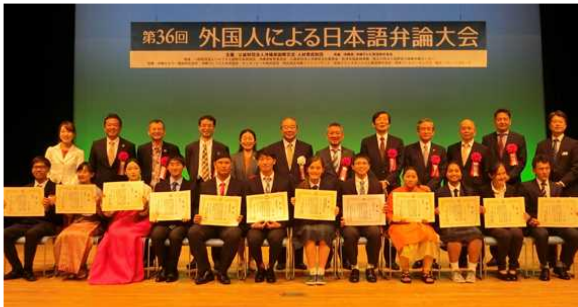
外国人による日本語弁論大会