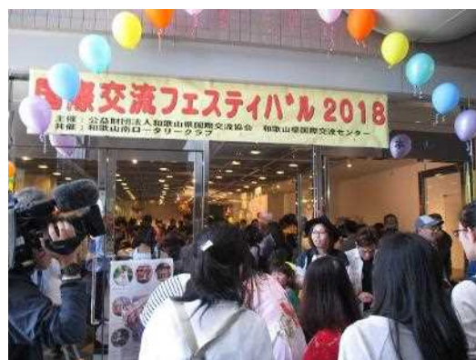
国際交流フェスティバル2018の開催