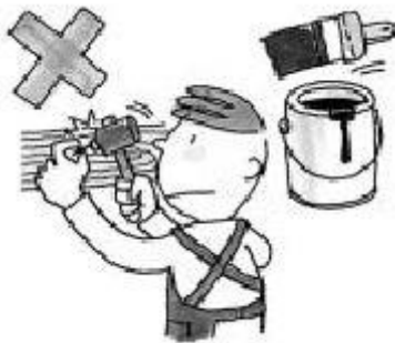
Nägeln in die Wand schlagen, streichen

Ohne die Einwilligung des Vermieters dürfen keine Änderungen oder Umgestaltungen an der Wohnung durchgeführt werden. Es dürfen keine Personen in der Wohnung aufgenommen werden, die nicht zur Familie gehören, ebenso ist eine Untervermietung eines Teils oder der gesamten Wohnung nicht gestattet.