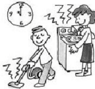
Geräusche von TV, Radio, Lautsprechern Geräusche von Staubsauger und Waschmaschine