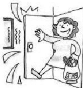
Ouverture et fermeture de la porte d'entrée