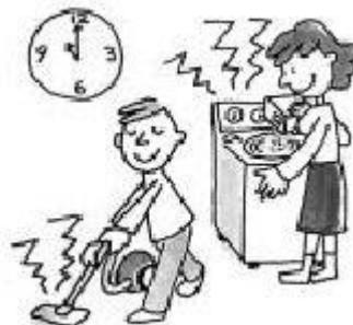
Aspirateur, machine à laver