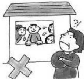
Meminjamkan rumah ke orang lain