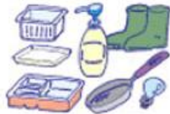
Sampah yang tidak dibakar.

Sampah makanan yang keluar dari dapur, jenis kertas, serbukun kayu, baju (tergantung dari setiap daerah cara pembagian sumber sampah).