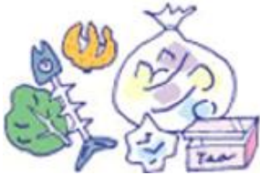
Sampah yang dibakar.

Sampah makanan yang keluar dari dapur, jenis kertas, serbukun kayu, baju (tergantung dari setiap daerah cara pembagian sumber sampah).