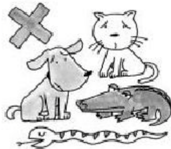
か ペットを飼うこと

やぬし おお か きんし か けいやく まえ ふどうさんや 家主の多くはペットを飼うことを禁止していますから、ペットを飼いたいときは、契約する前に不動産屋できちん たし だいじ と確かめておくことも大事です。