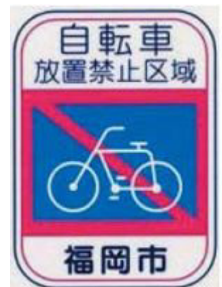
放置禁止区域標識

撤去された自転車を引き取る場合には、かぎと外国人登録証明書や運転免許証などの身分証明書が必要です。撤去されると保管料や移動料を払わないと返してもらえない場合があります。その場合は撤去と保管に要した料金を請求されます。