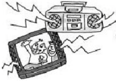
텔레비전, 라디오, CD 플레이어의 소리