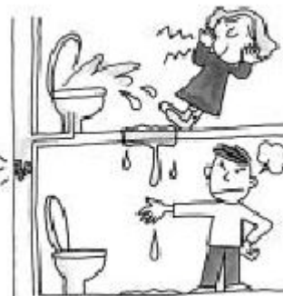
화장실용 휴지 이외의 것은 변기로 흘려 보내서는 안 됩니다.