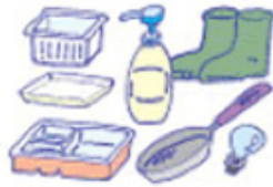
타지 않는 쓰레기