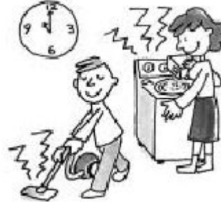
청소기나 세탁기의 소리