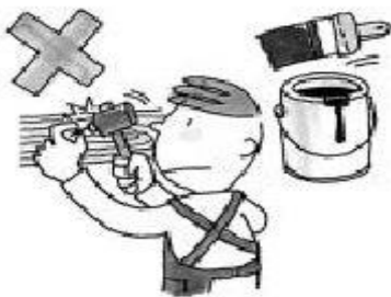
အခန်းတွင် သံရိုက်ခြင်း၊ ဆေးသုတ်ခြင်း

အိမ်ရှင်၏ ခွင့်ပြုချက်မရရှိပဲ အိမ်ပြင်ဆင်ခြင်း နှင့် အိမ်ဒီဇိုင်းပြောင်းလဲခြင်း၊ မိသားစုအပြင် အခြားလူကို အတူနေထိုင်စေခြင်း မပြုလုပ်ရပါ။ အိမ်၏ တစ်စိတ်တစ်ပိုင်း သို့မဟုတ် အားလုံးကို အခြားလူကိုငှားရမ်းခြင်း မပြုလုပ်ရပါ။