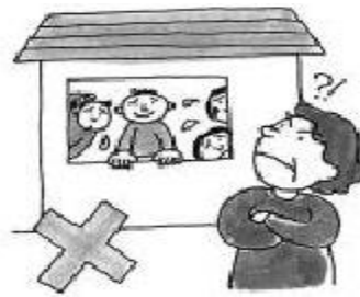
အခြားလူသို့ ငှားရမ်းခြင်း