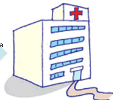
Hospital grande (Policlínica)

Sintomas e doenças graves, ferimentos graves