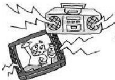
Шум от телевизора, динамика, радио, CD плеера, и т.д.