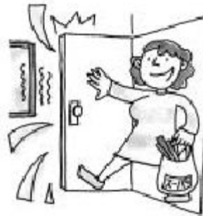
เสียงเปิดปิดประตู