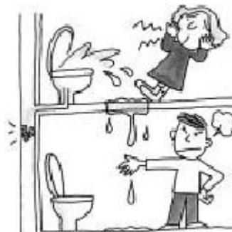
ห้ามทิ้งวัสดุอื่นนอกเหนือจากกระดาษชำระลงไป