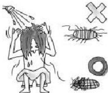
ถ้าท่อของโถส้วมตันน้ำจะล้นออกมา

ถ้าท่อระบายน้ำในห้องอาบน้ำหรือห้องสุขาตันจะกลายเป็นเรื่องใหญ่ เมื่อเกิดความเสียหายขึ้นกับห้องพัก ด้านล่างจะรับผิดชอบค่าซ่อมแซม (จ่ายเงินซ่อมแซมให้เหมือนเดิมเอง) ไม่ให้ผมไปติดที่ช่องระบายน้ำ ห้ามทิ้งวัสดุชนิดอื่นนอกเหนือจากกระดาษชำระ(ละลายน้ำได้)ลงในโถส้วม (ห้ามทิ้งกระดาษทิชชู(ไม่ละลายน้ำ)และผ้าอนามัยลงไป)