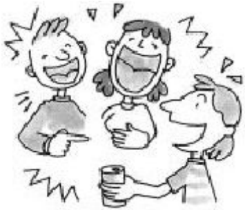
เสียงพูดคุยดังๆ