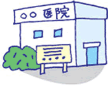
Klinik or tanggapan ng dukor

Para sa sipon, sakit ng tiyan, di-malubhang karamdaman