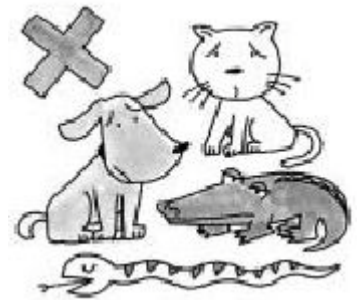
Pag-aalaga ng mg hayop

Maraming mga may-ari ng bahay na hindi gustong mag-alaga ng mga hayop ang mga mangungupa kaya kailangang tanungin muna ang tungkol dito sa fudousanya bago bumuo ng kontrata o kasunduan.