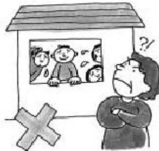
Pagpapaupa ng bahay sa ibang tao