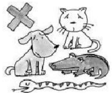
Pag-aalaga ng mg hayop

Maraming mga may-ari ng bahay na hindi gustong mag-alaga ng mga hayop ang mga mangungupa kaya kailangang tanungin muna ang tungkol dito sa fudousanya bago bumuo ng kontrata o kasunduan.