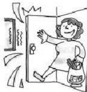
pagbukas at pagsara ng pintuan