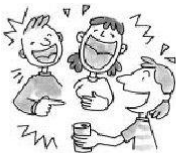
pag-uusap nang may malakas na boses