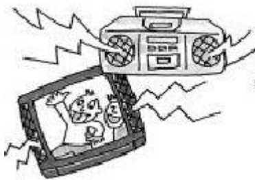
ingay mula sa telebisyon, ispiker, radyo