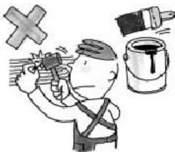
在房间里钉钉、涂漆

未经房东许可，是不可以进行改造或装修、以及与家属以外者一起居住。当然也不能把住宅的一部分或全部转租他人。