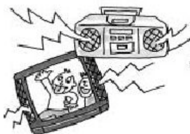
电视机、收音机、CD 播放器所发出的声音