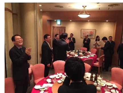
兵庫県歓迎夕食会

中華街があるまちらしく、中華料理を囲んだ。中華人民共和国駐大阪総領事館からも2名参加があった。