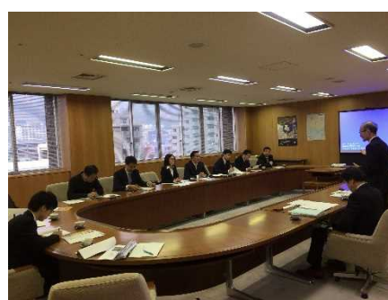
兵庫県観光部局ブリーフィング

兵庫県庁では、国際関係課や観光関係課を管轄する産業労働部や農政環境部農政企画局消費流通課からの出席があった中で、ブリーフィング及び意見交換を行った。参加者からは、観光に対する政策や農作物の認証制度に対する質問があった。