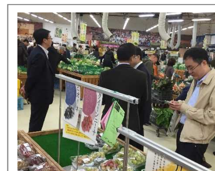
JA直売所「六甲のめぐみ」視察

職員から売上高や農家数について説明があり、参加者からは農協の制度やメリット、衛生管理のチェック体制等について質問があった。売場視察も行い、生産者が直接持ち込むため、輸送経費等が削減され、参加者は安価な印象を受けていた。