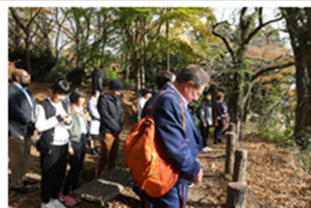
(避難場所にて黙禱)

高台への避難終了後には黙禱をおこない、被災者の冥福と被災地の一日も早い復興を願った。