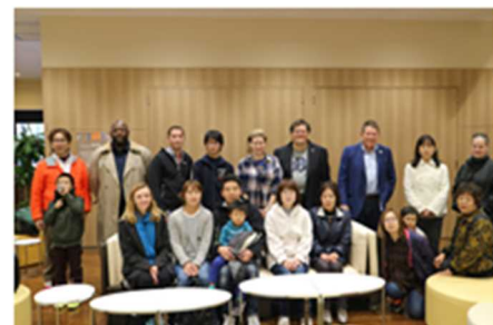
(ホストファミリーと)

ホームステイ終了後、振返りをおこなった。参加者からは、英語が通じなくても翻訳機を使うことでコミュニケーションをとり、日本文化体験や観光等で交流を深めたとの意見がでた。