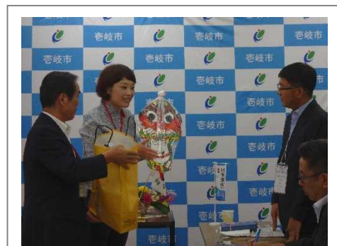
壱岐市長表敬訪問

壱岐市の観光施策の基本方針や今回の視察の概要などについて説明がなされた。参加者からは、インバウンド関係の補助制度や住民のかかわり方など、多くの質問が寄せられ、関心の高さが伺われた。