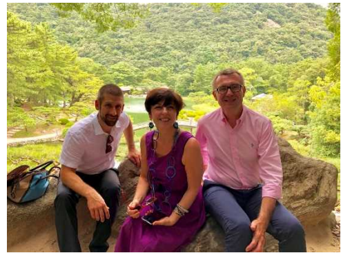
視察：栗林公園にて記念撮影

夏の野外での視察ということで、大変暑い中で視察だったが、庭園の美しさもさることながら、和船周遊や抹茶体験などの文化体験を実施できたことで、参加者の満足度も非常に高い視察先であった。