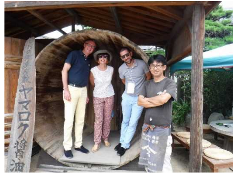
視察：ヤマロク醤油株式会社社長と参加者

小豆島で400年の伝統を誇り、4大産地の一つに数えられ、自社製品をフランスに輸出しているヤマロク醤油株式会社を訪問。参加者も試食する機会があったが、参加者は薄味のさっぱりした醤油を好んでいた。