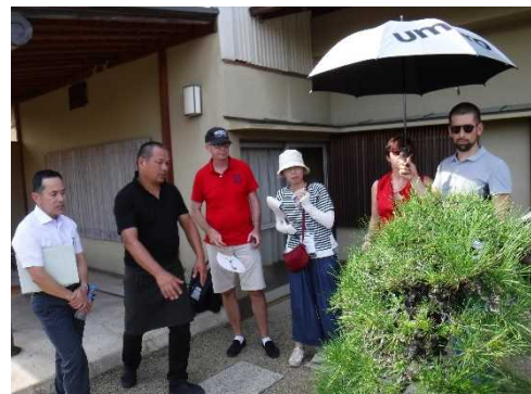
視察：中西珍松園（盆栽の里）

盆栽の里鬼無町にある中西珍松園を訪問した。盆栽はフランスでも人気があるようで、参加者は皆盆栽に興味を示していた。この盆栽はいくら？と聞いた参加者はその額の高さに驚いていた。