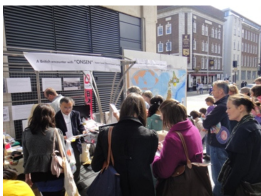
ロンドン事務所ブース

さらに、140を超える屋台（ブース）が出展しましたが、その半分以上が飲食物の販売で、焼そば、カツカレー、焼き鳥、お好み焼き、豆腐、日本酒、和菓子などが扱われていました。この他、漆器や着物・浴衣の展示販売、習字や俳句、折り紙の体験、それから旅行代理店の屋台も5つほど出展し、日本への旅を勧めていました。