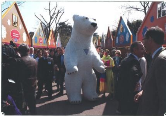
園内遊歩道の両側を埋めるブース