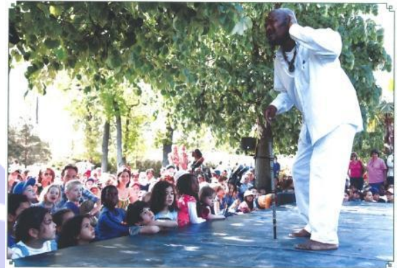
ステージに魅了される子供たち