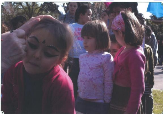
インドの伝統的なフェイスペイント に挑戦する子供たち

公園内にあるアトリエ館を利用し、子供たちを中心とした来場者を対象にした様々な体験コーナーを設置し、武道や書道、料理教室や着物の着付けをはじめ、その場で気軽に体験できる折り紙やあやとりなど、日本の伝統的な文化や遊びを体験していただくことができます。