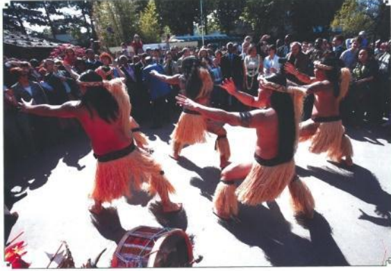
オープンスペースを利用し 伝統的な踊りを披露

公園内の遊歩道や芝生などのオープンスペースを利用し、阿波踊りやねぶた祭りといったダイナミックな踊りを伴う行列や祭り神輿、武者行列や手筒花火といった、日本の地域色あふれる元気なアトラクションを行っていただくことができます。