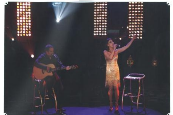
劇場内ステージにおける公演