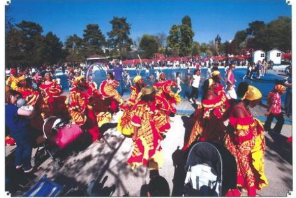
民族衣装に身を包み 会場内をパレード