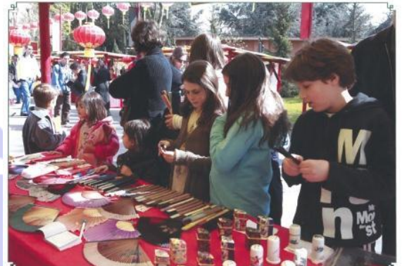
ブース内で販売される 地域の伝統工芸品