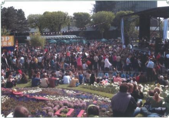
屋外ステージ実施状況

会場に設営された屋外ステージまたは常設劇場舞台において、音楽やダンス、伝統芸能等パフォーマンスを行っていただくことができます。