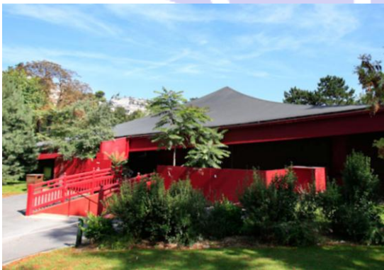
公園内常設劇場 (300 人収容)