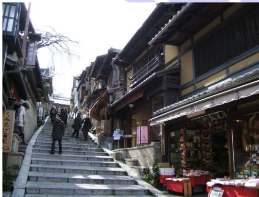
今回のイベントにおいては、現代風 「楽市・楽座」をイメージしたブース を検討中