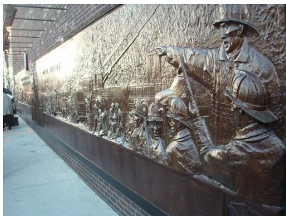
FDNY Memorial Wall。殉職した消防士の名前のリストも掲示されている。

グラウンド・ゼロ周辺には現在、今年9月11日の追悼セレモニーの際にオープンした「9/11 メモリアル」、殉職したニューヨーク市消防局の消防士を称える「FDNY Memorial Wall」、テロの様子を時系列に説明するパネルや展示物のある「9/11 Memorial Preview Site」、ワールドトレードセンター・ギャラリーのある「Tribute WTC Visitor Center」、映像で当時の様子を紹介するとともに関連アイテムの販売をする「9/11 Memorial Visitor Center」等いくつかの関連施設等がある。このほか、バッテリーパークには、ワールドトレードセンター広場の飾りであった天球が記念碑として設置されているほか、当時救助隊員の休憩所として使用されたセント・ポール教会では犠牲者の友人や家族の思い出の品等が展示されている。