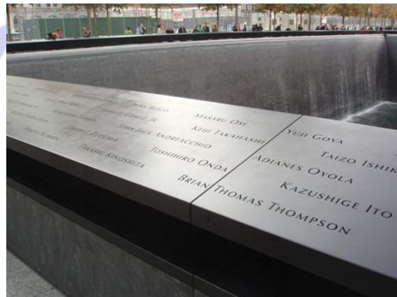
犠牲者の名前が刻まれたサウスプールの慰霊碑

「9/11 メモリアル」への入場は完全予約制となっている。ウェブサイトによる事前予約が必要で、入場の際は空港並みのセキュリティチェックがある。1 週間以上前でも予約がいっぱいということもあり、県知事の訪問の際も当初は予約が取れない状況であった。今回の訪問の趣旨や広島県知事献花の意義についてメモリアル側と交渉の結果、当日の入場及び