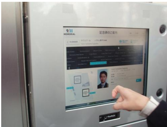
日本語の表示もあるタッチパネル

「9/11 メモリアル」はツインタワー跡地に建てられた追悼公園である。かつてサウスタワー、ノースタワーのあった場所には人工滝のある池が建設され、池の周りの追悼碑には各ビル等で犠牲となった方々の名前が刻まれている。犠牲者の名前がどこに刻まれているかは、ウェブサイト及び現地のタッチパネル式機械で簡単に検索することができる。今年 9 月に訪問された野田首相夫人が日本人の名前を見つけられ黙とうされたのは、N22（ノースプールの 22 エリア）であるが、私たちが訪問した際も、サウスプールの 45 エリア付近で多くの日本人犠牲者の名前を見つけた。