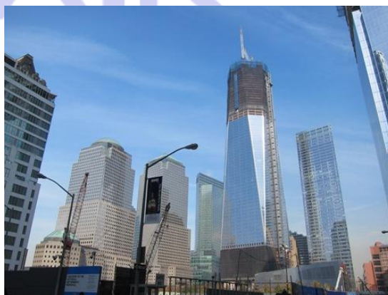
建設の進む新ワールドトレードセンタービル