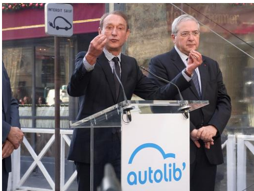
式典であいさつをするドラノエ・パリ市長 (左側)

サービス開始当日にパリ市役所からほど近い場所以で行われた開始式典で、ドラノエ市長は、「21 世紀の都市は、都市の住民に移動手段の自由な選択肢を提供する」ことこそが重要で、Autolib'はそのスローガンとして掲げる「空気のように自由」をまさに体現するものだとスピーチ。Autolib' にかかるドラノエ市長の意気込みと自信を感じさせました。