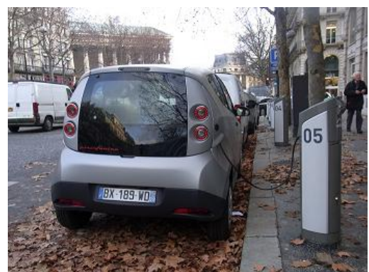
ステーションに停車中の Bluecar (車体の色は、Vélib'と同じグレー)