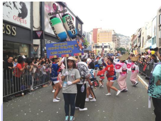
街頭パレードの様子