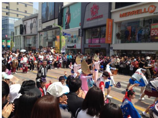
街頭パフォーマンスの様子