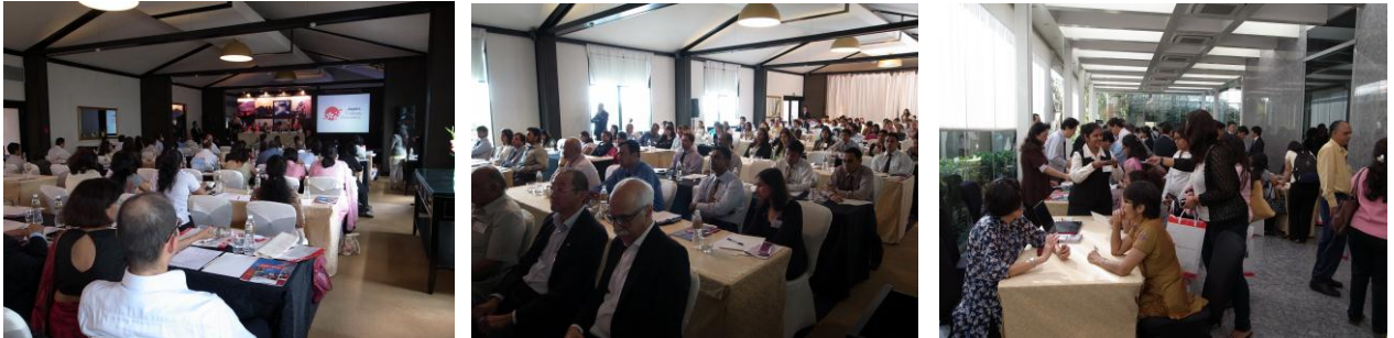
賑わうセミナー及び情報交換会場

セミナーの後は参加団体がそれぞれブースを設けての商談会・情報交換会が開催され、日本の情報得るために多くの関係者が集まった。日本側の参加者によると、特に東京、富士山、京都、大阪のゴールデンルートや北海道に関する質問事項が多かった。また、現在日本に行くためにはビザが必要なことから、ビザに関する質問も多く出た（必要書類や所要日数等）。