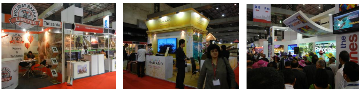
各国 NTO のブース (タンザニア、タイ、フィリピン)