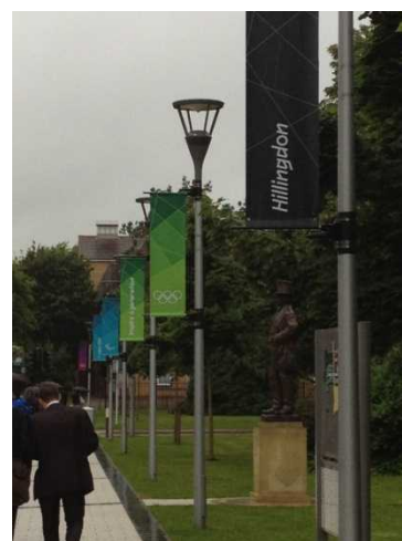
※ブルネル大学構内。オリンピックに染まっています。

もし、日本にオリンピックがやってきたら、自分の自治体はどんなふうにオリンピック特需を乗りこなせるか考えてみるのも楽しいかもしれません。