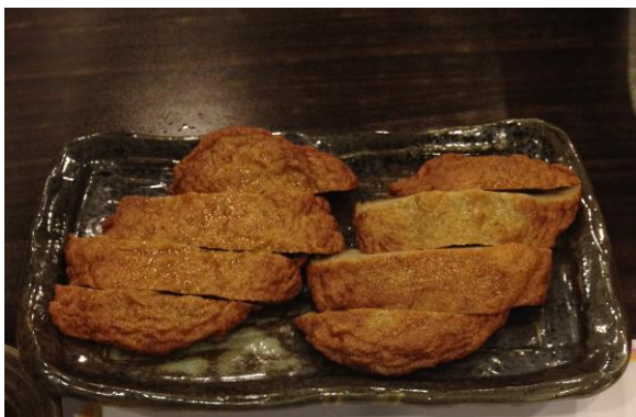
愛媛県名産のじゃこ天

『じゃこ天』は韓国人の方には馴染みがないため、どういうものか店員に聞かれる方が多く、興味を持って、おいしく召し上がっていただけたようでした。さらに、『じゃこ天』を注文していただいた方には愛媛県の観光情報が掲載されているメモ帳をプレゼントしました。