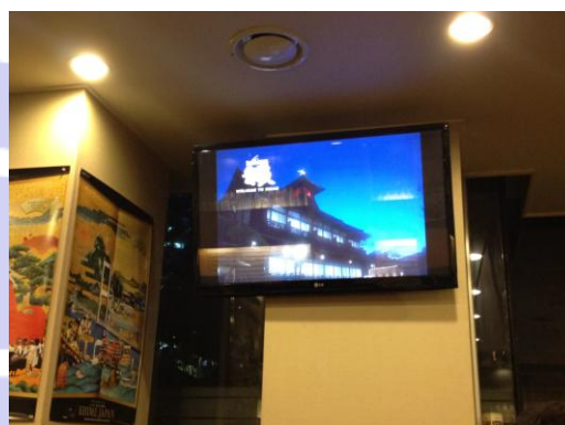
店内での DVD 放映の様子