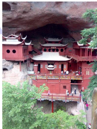
江蘇省・鎮江の「甘露寺」