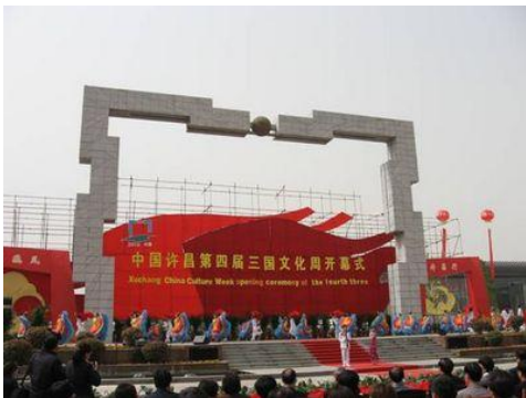
許昌の「三国文化ウィーク」

また、南陽市は「諸葛孔明祭り」を何回も挙行しているほかに、9 億元(約 112.5 億円)を投資して諸葛孔明が住んでいた臥竜岡を整備し、『南都賦』に基づいて観光施設を建設しています。