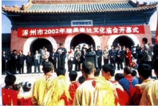
河北省涿州の「楼桑春社文化縁日」

中国は三国文化の発祥地であり、三国遺跡を数多く有しているため、経済発展とともに文化や観光分野における市場ポテンシャルが大きいと見込まれています。一方、日本には三国文化が深く浸透しており、三国志をテーマにしたアニメなどコンテンツ産業が進んでいます。この三国文化を軸にして、今後益々両国は観光、文化、コンテンツ産業等の分野における更なる協力が期待できると思います。