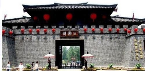
無錫太湖の「三国城」ロケ地