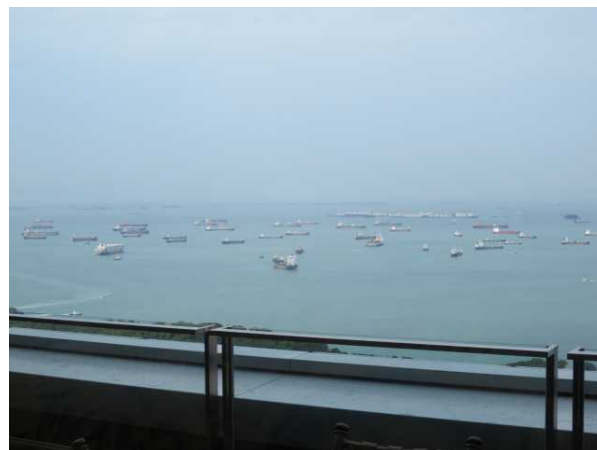
沖に停泊しているコンテナ船