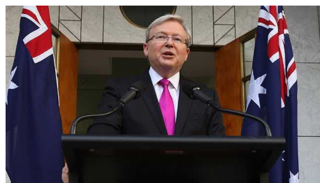
図4 首相による選挙の発表

ケビン・ラッド首相(当時)が、9月7日(土)に選挙を行うことを発表。発表当日、発表の前に連邦総督に対して選挙日程の助言を行っている。