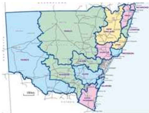
図2 NSW州の下院選挙区

オーストラリアでは、住民票の制度がないこともあって、選挙権を得るためには自ら選挙人名簿への登録をしなければなりません。選挙人名簿への登録は、連邦選管事務所や郵便局などでできるほか、ウェブサイトからも可能となっています。また、16 歳になると事前に選挙人名簿に登録することも可能です (もちろん、18 歳になるまでは選挙権はなし)。この選挙人名簿への登録は、連邦議会選挙、州議会選挙、市議会選挙の3つを兼ねたものとなっています。