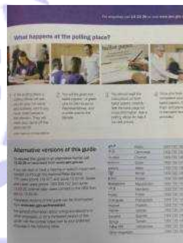
図 9 ガイドライン

ほか、 ウェブサイト からも各言語に翻訳されたものがダウンロードできるようになっています。