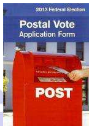
図3 郵便投票の呼びかけ