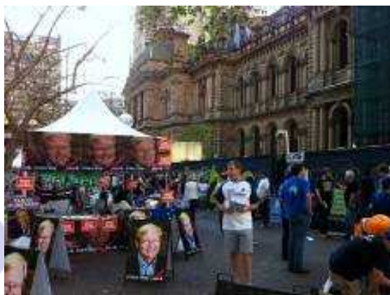
図1 投票会場の様子

今年4月にシドニーに赴任して以来、初めての選挙を体験すると(静観しただけですが)、日本のそれとはさまざまな相違点を見つけることができました。オーストラリア選挙制度の概要と選挙の様相を報告します。