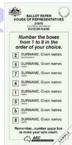
図 7 下院投票用紙