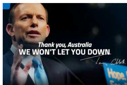
図5 アボット党首の勝利宣言

なお、今回の総選挙については即日大勢が判明し、9月19日にアボット氏が正式に首相に就任している。(9月29日時点で最終的な選挙結果は判明しておらず、もちろん選挙報告もされていない)。