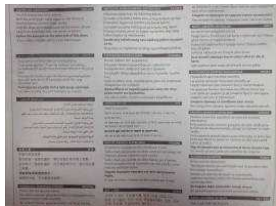
図 10 16 言語での解説

前述のように、投票所前では各政党の支援者がピラを配布しており(図1及び8)、その中の1政党のピラの裏面には、英語を含む16言語で投票の方法が解説されていました(図10)。選挙事務にはたくさんの臨時事務補助員をしていますが、その中には、先住民(アボリジニー及びトレス諸島民)や文化的・言語的な多様性を持った有権者の投票をサポートする職員が含まれています。