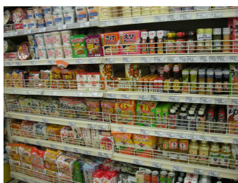
スーパーの日本食コーナー

ファストフード店やラーメン店も進出しており、一般層に浸透してきています。今後は居酒屋チェーンのオープンも予定されていますし、日本からのフランチャイズだけでなく、現地で生まれた日本食風のファストフードチェーンも展開されており、日本食の人气が窺