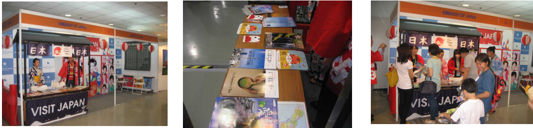
(左から) 開場前の日本ブース、各地のパフレット、開催中の日本ブースの様子