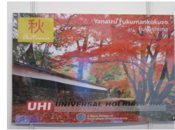
訪日取扱大手旅行社の広告

今回の TME でも、東京周辺または東京と大阪のツアーは人気がありましたが、高価格帯の商品であるため、現段階では購買層はほぼ富裕層に限定されています。訪日旅行の人気商品に影響されて、ブースを訪れるお客様も主に東京・大阪・京都の情報を求める方が多いのですが、フィリピンでは、現在これら人気旅行地に続く地域が予測できない状況です。