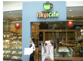
ショッピングモールの日本風カフェ

フィリピンの方には、アメリカ、日本、シンガポールといった先進国に対する憧れがあり、第二次世界大戦の舞台となったにも関わらず、現在の対日感情は良好と言えます。街を走る車に日本車が多いばかりでなく、高級ショッピングモールには日本食のレストランや日本ブランドのお店が並んでいます。日本食に関しては高級路線だけでなく、