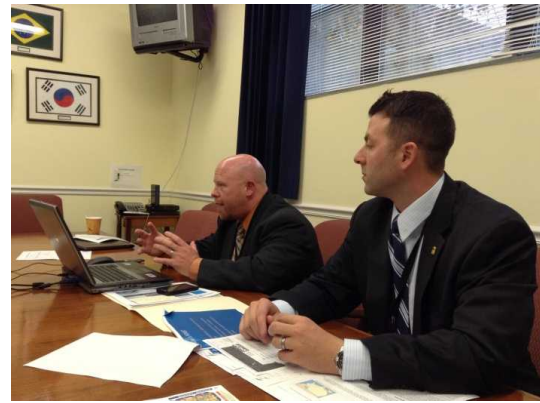
州警察担当者（右）から防犯カメラの設置場所（左）についての説明を受けている状況。