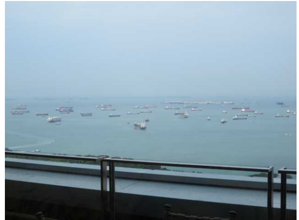
沖に停泊しているコンテナ船