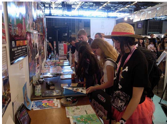
福岡市はアニメ・ゲーム関連の産業をPR

今回、福岡市ではフランスのコンテンツバイヤーなどとの会談を行い、実際に商談に結びついた案件もあったそうです。ジャパンエキスポでは会場内に「B to B スペース」が設けられ、出展者と来場者のマッチング及び商談が可能になっています。単にコンテンツを展示して一般客にPRするだけでなく、訪れた業界関係者にコンタクトをとることで、ジャパンエキスポは具体的なビジネスを展開する場として活用することもできるのです。