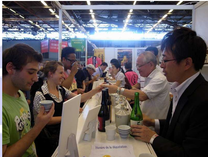
県産品の試食を行った長崎県ブース

ジャパンエキスポは食品専門の展示会ではなく、来場者のほとんどは食のプロではありません。しかし、彼らは日本文化のファンであるだけに意見聴取に協力的で、広く消費者の生の声を聞くことができます。地域産品のプロモーションのスタートとして、一般のフランス人の嗜好を知るうえでは非常に良い機会であると感じられました。