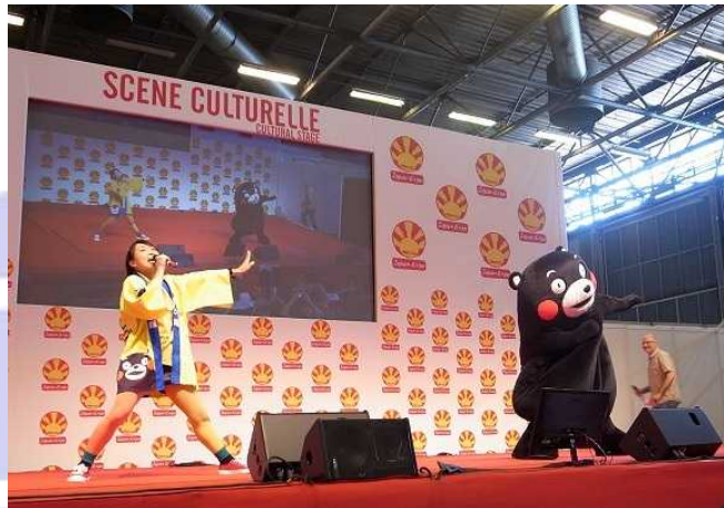
昨年に引き続いて登場したくまモン

パリはヨーロッパの中心都市のひとつであり、世界に向けて情報を発信するためにもってこいの場所といえます。ジャパンエキスポ出展に併せてパリで独自の PR 活動を行う自治体が、今後とも増えるかもしれません。