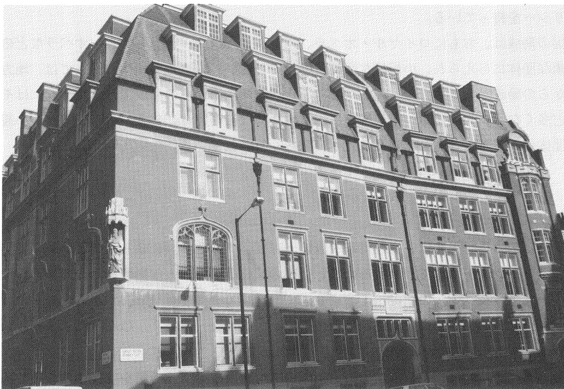
アーツ・カウンシル

の活動内容が変化した。1942年には、アマチュアだけでなくプロの芸術と芸術家を強化するために CEMA が国有化され、経済学者として有名なジョン・メナード・ケインズが会長に就任した。1945年に政府は、CEMA を "The Arts Council of Great Britain" として存続させることを発表した。1946年、ケインズは『大衆が容易に参加できる高いレベルのプロフェッショナルな芸術の促進』（これは、現在では矛盾を孕んだものとして認識されている。）をアーツ・カウンシルの目的として憲章に定めた。ケインズの功績としては、アーツ・カウンシルの決定権の大部分を内部の委員や事務職幹部から外部の諮問委員会に移したこと、戦争中ドイツ軍の爆撃等の理由で閉鎖されていたロイヤルオペラを再開したことがあげられ、これらは以後のアーツ・カウンシルの存在意義に多大な影響を与えている。