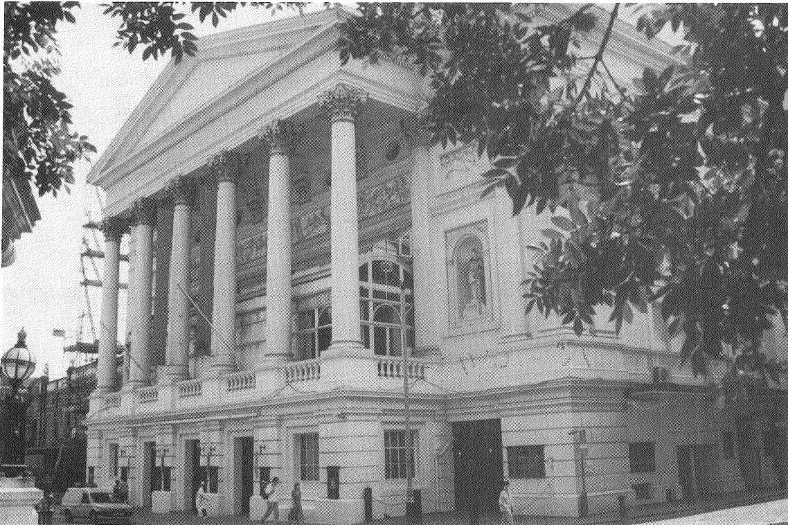
ロイヤル・オペラ・ハウス