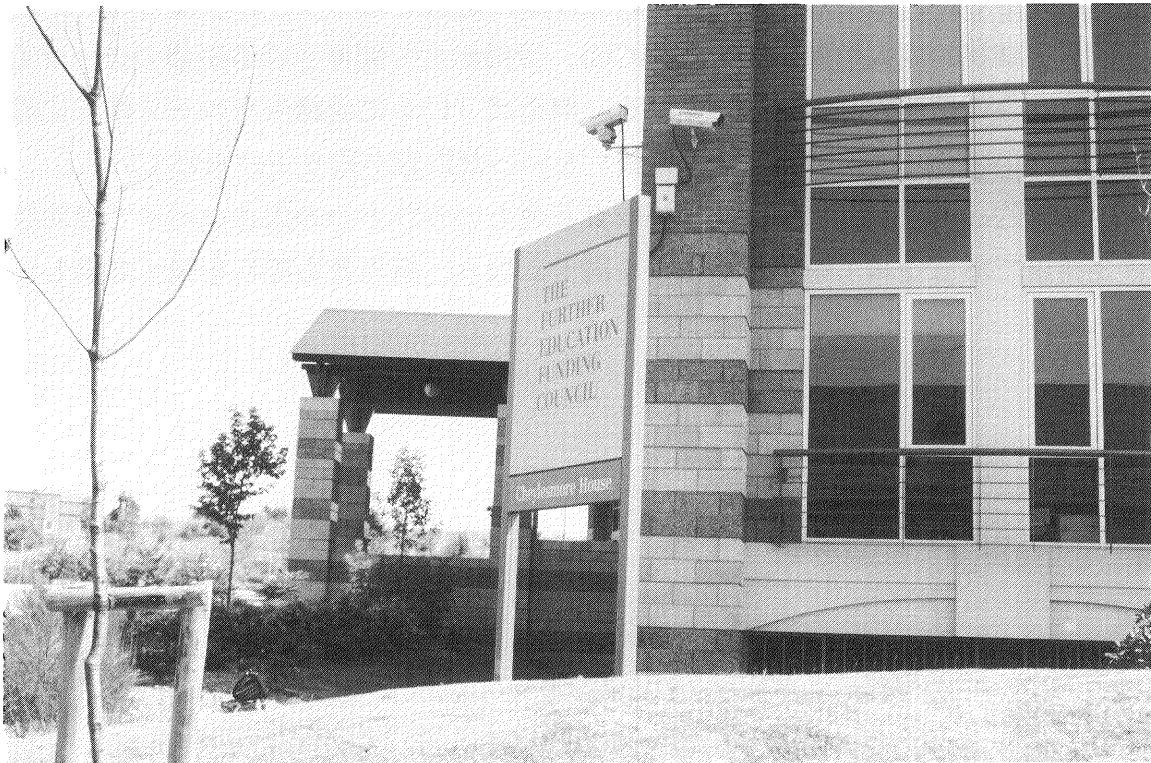
継続教育基金の近代的な建物（コベントリー市）