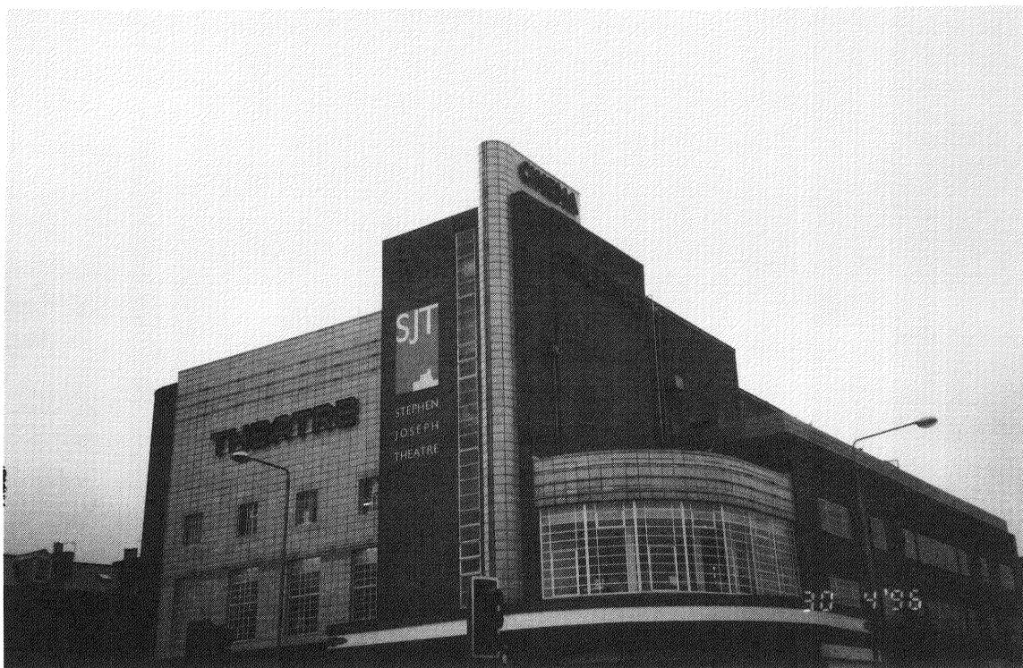
スティーブン・ジョセフ劇場

ナショナルロッタリーは多くの悲喜劇を生んでいます。ギャンブルの善し悪しは別として、ロッタリーの普及は、市民や民間団体のチャリティ団体に対する寄付を確実に減少させています。