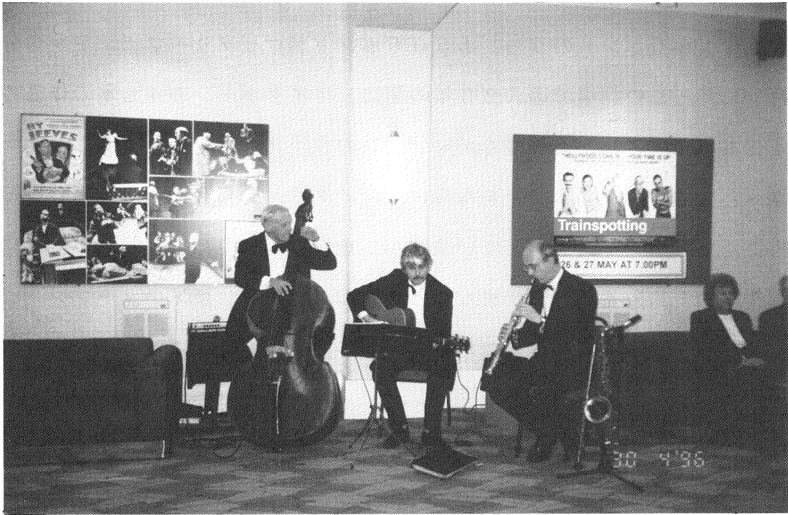
新劇場のオープニング風景