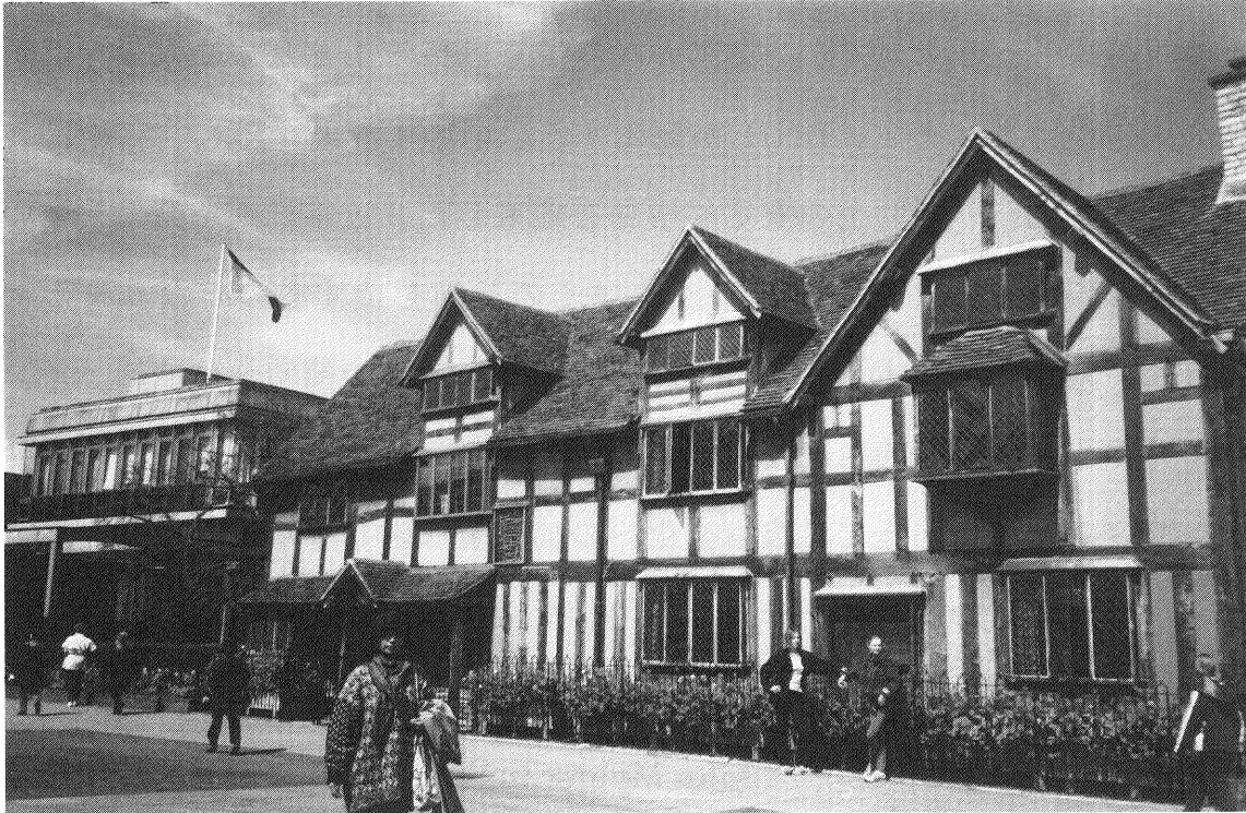
シェークスピアの存在しないストラットフォード アポン エイボンは 考えられない