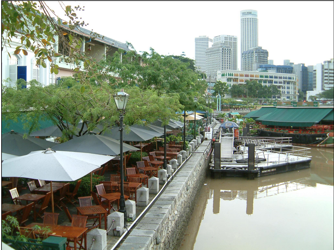
シンガポール川沿いのクラーク・キー地区。屋外レストランなどが立ち並び、昼夜にぎわっている。