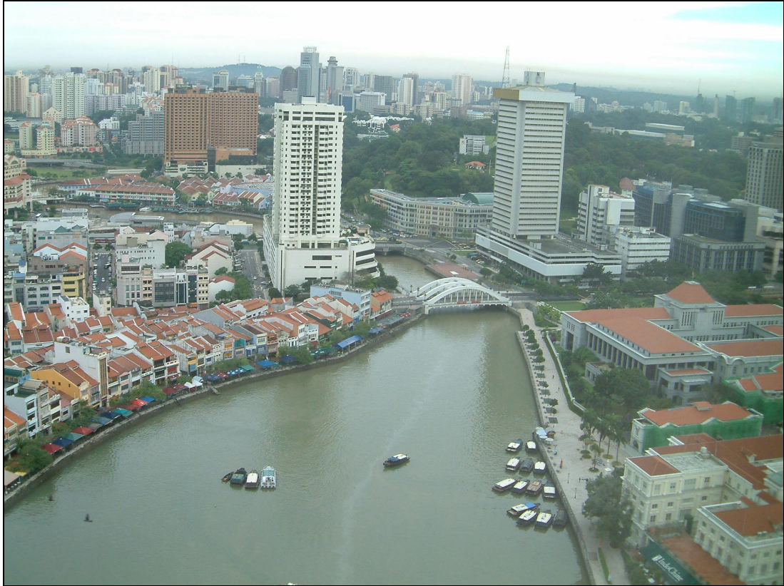
現在のシンガポール川周辺。川沿いは美しい遊歩道となっている。