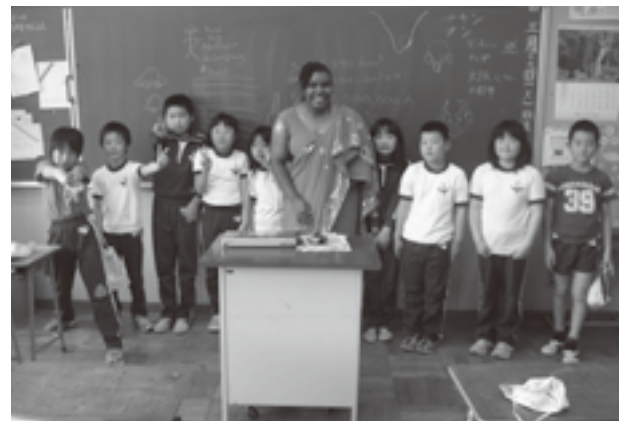
インド旅行のことを教える

外国人はいつも見つめられます。町に初めて来た週、朝7時頃ランニングをしていたら、高校生たちが同じ道を歩いていました。その1人が私を見ながら側溝に嵌まりました。それを見た彼女の友だちが彼女を笑っていました。あの時から、私は時々あの子について考えています。なぜあの子は側溝