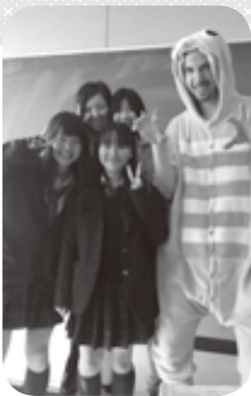
ガチャピンの秘密の正体

といったら、JTE 1人でもできるでしょう。だからJETプログラムのALTは、普通の英語の先生より多く目指すことが当然です。