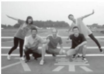
スカイダイビングの後

JETプログラムが英語の教育より広い意味を持つてるということは明らかです。私は生徒との関係が、先生と友だちとの半ばで、あいまいな位置にあるとわかった結果、生徒と平等な立場に立って深く交流できている長所があると思います。私は授業以外にもよく生徒と遊んだりしていて、日本語で話すことも多いです。サッカー一部の訓練に参加したこともあり、またこの間文化祭に出で、フラメンコを生徒と一緒に踊り