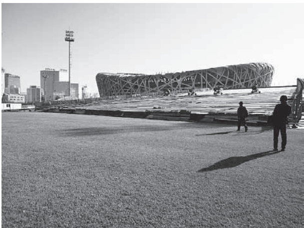
鳥の巣スキーパーク

1月には『鳥の巣スキーパーク』を運営している『北京懷北国際滑雪场』のスタッフ6名が長野県を訪れ、スキー場等を視察しました。この訪問を契機に『北京懷北国際滑雪场』と『鳥の巣スキーパーク』に長野県コーナーが設置されることになり、ポスター掲示やパンフレットの配布をしていただけることとなりました。両スキー場の年間来場者は計40万人を超えており、長野県としては、中国人スキーヤーへのまたとない情報発信の拠点を得ることができました。