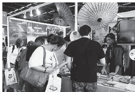
クレアパリブースの様子

来場者からは、日本を観光する場合の安全性や物価の高さについての質問もありました。しかし、チェルノブイリの原発事故を直接経験していない若い世代からは、不安よりも日本に行ってみようという意欲がより強く伝わってきました。