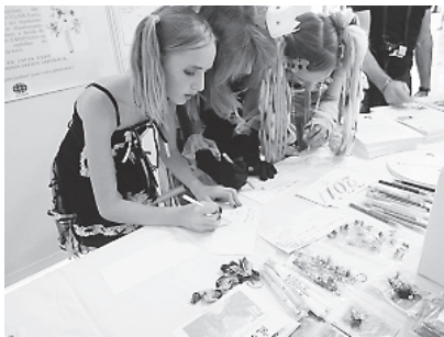
カードに記入する子どもたち

現在、フランスでは、ポップカルチャーは若者が日本に親しみを感じ日本に引きつけられる重要なチャンネルになっており、今回のPR活動をきっかけに、彼らの日本に対する興味がより深まり日本訪問につながっていくことを期待したいと思います。